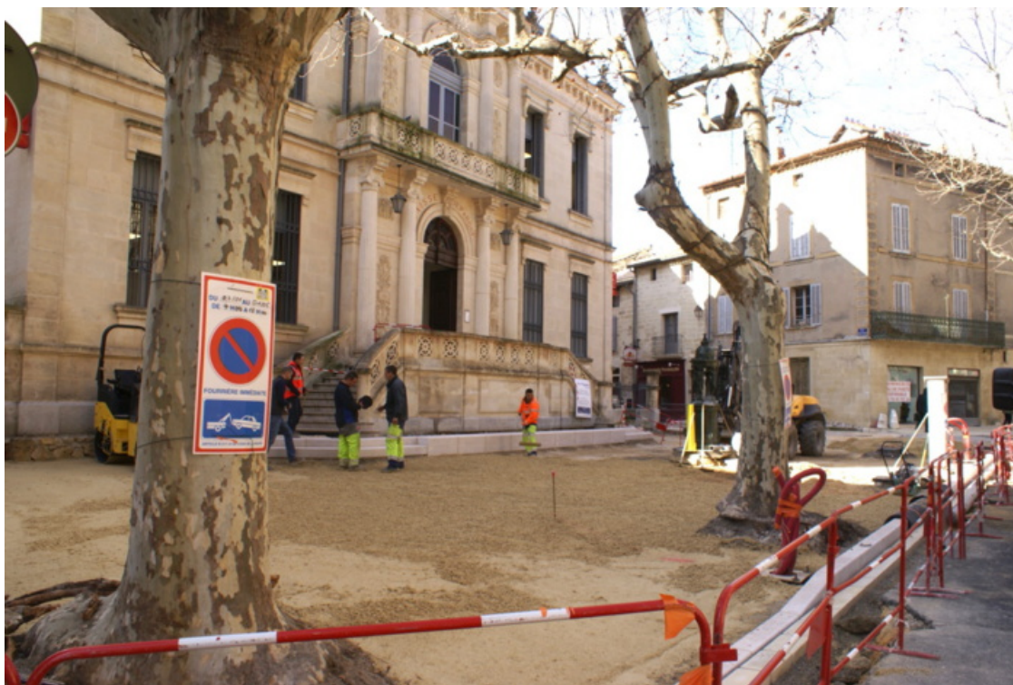
Place Belle Croix, Uzès - 14/02/2019