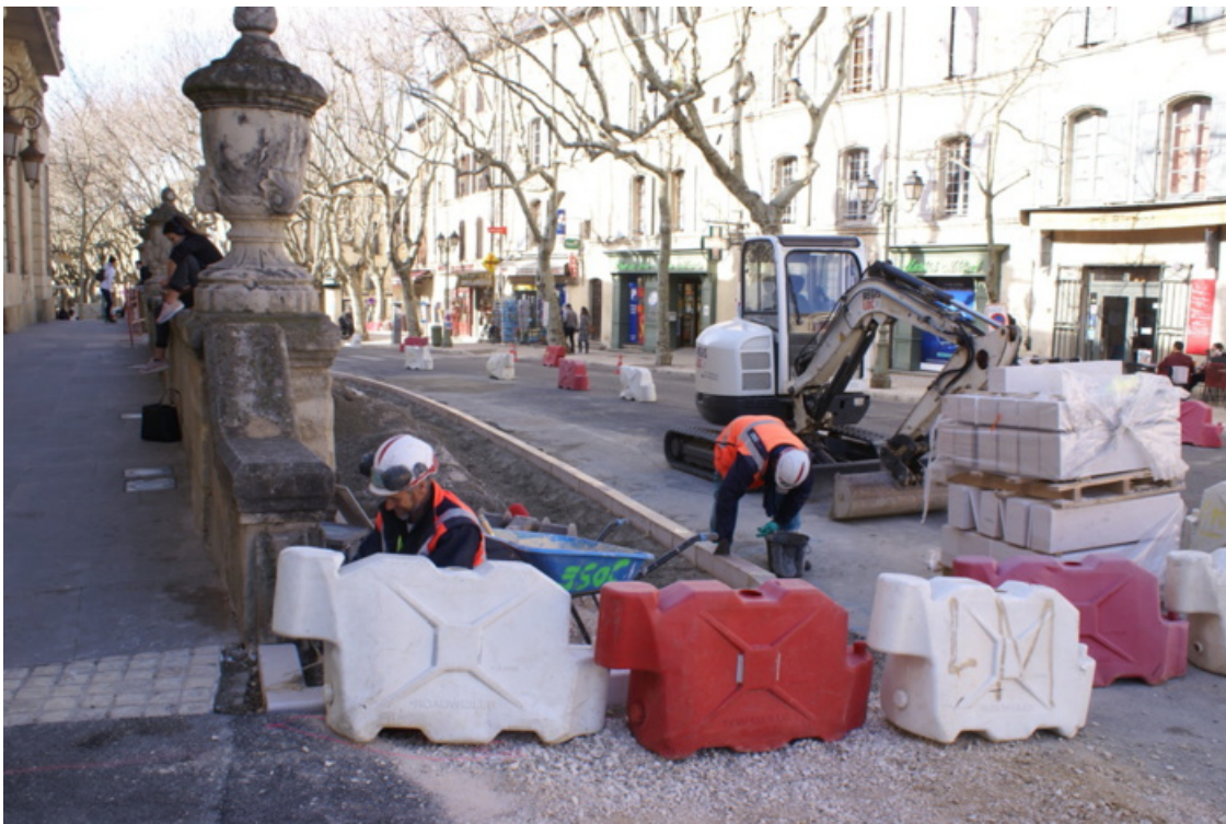
Place Albert 1er, Uzès, 14/02/2019