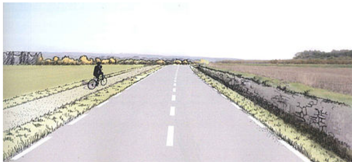
Avant-projet paysager liaison interquartier Mayac-Mas de Mèze.

Ce projet permet de contourner le centre-ville d'Uzès pour l'ensemble des usagers de la route en reliant le quartier récent de Mayac à la RD 981, un axe majeur assurant la jonction avec Montaren, Alès et au-delà l'autoroute A9.