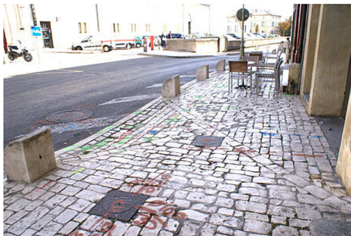
Marquage pour repérer les réseaux enterrés, boulevard Charles Gide à Uzès

des marquages au sol réalisés par Detect réseaux, pour établir les plans topographiques intégrant ces réseaux enterrés. »