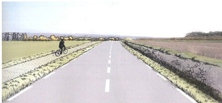
Avant-projet paysager liaison interquartier Mayac-Mas de Mèze.

Ce projet permet de contourner le centre-ville d'Uzès pour l'ensemble des usagers de la route en reliant le quartier récent de Mayac à la RD 981, un axe majeur assurant la jonction avec Montaren, Alès et au-delà l'autoroute A9.