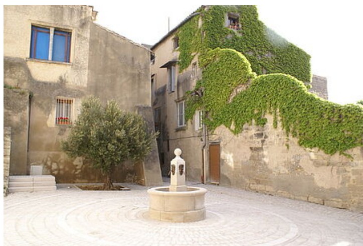
Placette végétalisée et rues pavées pour embellir le quartier St Roman

En 2016, l'aménagement urbain du centre ancien d'Uzès s'achève avec la rénovation de trois rues : St Roman, de la Ferté Milon et du docteur Blanchard à l'image du quartier des "Bourgades".