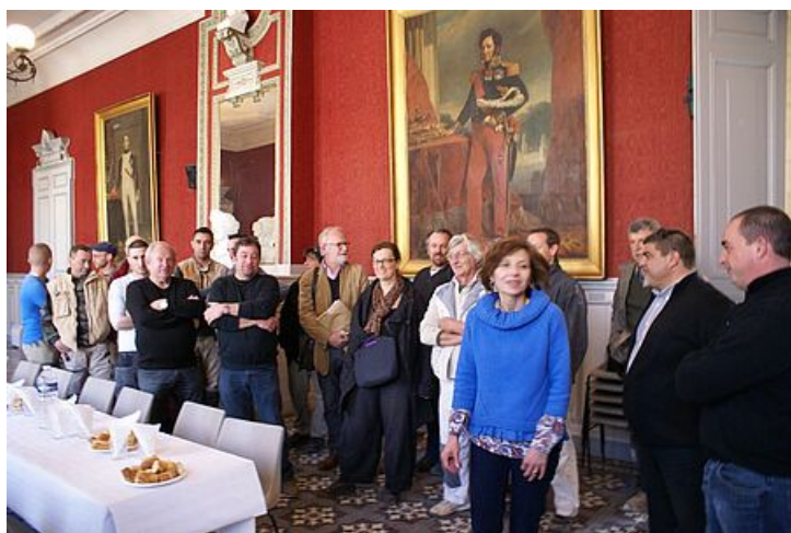
La rénovation de l'hôtel de ville aura mobilisé trente personnes dans différents corps de métiers.

L'important chantier de l'Hôtel de ville d'Uzès s'achève avec l'installation d'un ascenseur qui sera mis en fonctionnement sous une quinzaine de jours. Lundi 10 mars 2014, la grue qui obstruait la vue sur la façade du bâtiment classé était retirée.