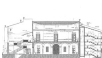
Deux escaliers de secours sont ainsi installés de part et d'autre de l'édifice, dans les bâtiments annexes, rue du Sénéchal et rue du Salin. Plan Gabrielle Welisch, architecte

L'ascenseur permettra d'accéder au premier étage de l'hôtel de ville. Il sera accessible par la cour intérieure, dans l'aile sud-ouest, rue Sénéchal. Il pourra accueillir 8 personnes, pour une charge de 680 kg. Les boutons de commande au palier et en cabine seront de grandes dimensions, gravées en écriture braille et seront équipés d'une confirmation d'enregistrement par signal sonore et lumineux aux paliers.