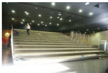
Installation des gradins déployables dans la salle polyvalente, un nouveau vœu exprimé et accordé aux initiatives culturelles

A compter du 13 décembre, la salle polyvalente d'Uzès s'équipe de nouveaux gradins escamotables, multidirectionnels et déplaçables pour accueillir l'offre culturelle de la ville dont la programmation théâtrale de l'ATP d'Uzès.