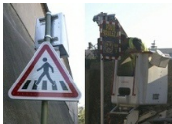
Deux radars clignotants préviennent des passages de piétons. Un radar indique la vitesse de l'automobiliste à son arrivée dans la ville et l'incite à freiner.

Maîtrise des coûts et d'énergie : trois radars pédagogiques viennent d'être installés devant l'école maternelle du Parc, avenue Georges Pompidou, au croisement de l'avenue de la gare et de l'avenue du 8 mai ainsi que sur l'avenue des Cévennes, la route d'Alès.