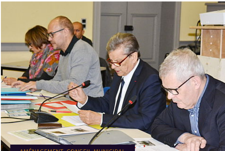
AMÉNAGEMENT, CONSEIL MUNICIPAL