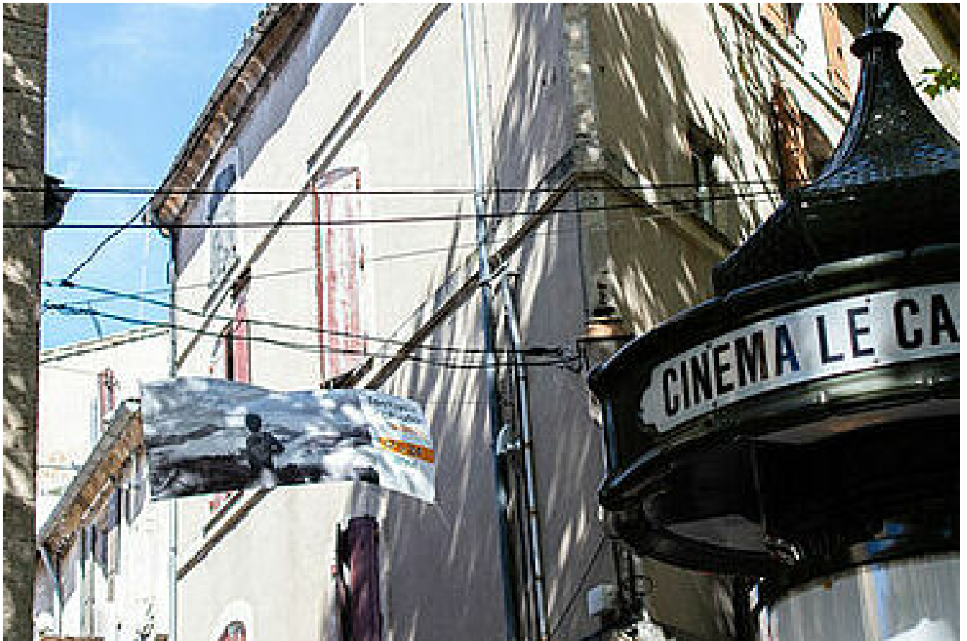
Cinéma Le Capitole d'Uzès