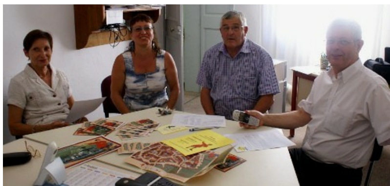
Présentation du forum des associations et du jeu de piste de la ville d'Uzès.

Le lancement officiel s'effectuera pour le forum des associations, le samedi 8 septembre 2012 prochain au jardin de l'évêché, le matin uniquement. Ensuite, il sera largement diffusé pour les journées européennes du patrimoine, les 15 et 16 septembre prochains dans différents sites.