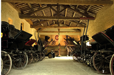
7. Salle des attelages