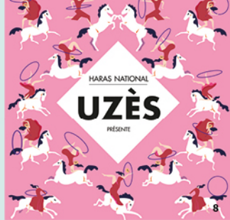
8. Spectacle «Les cavalières d'un autre temps»