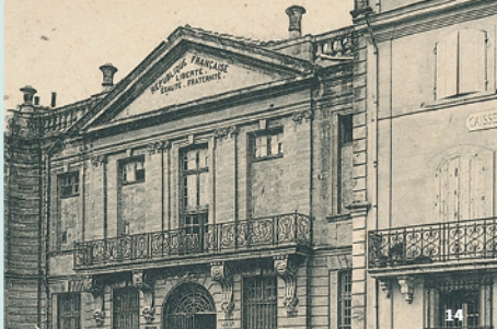
14. Fronton de l'hôtel de Ville d'Uzès

Le dessinateur Jépida, disparu en 2020, nous a laissé de savoureux dessins ayant pour décor les monuments d'Uzès. Place à l'artiste et son regard décalé.