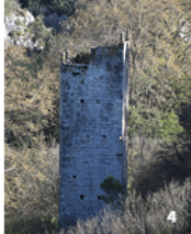
3. Vallée de l'Eure