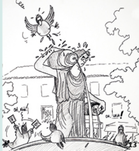
13. Jépida «La fontaine de la dame» coll. D. Libor