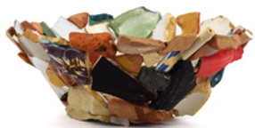
10. Jean-Marc Saulnier © Musée G. Borias - Ville d'Uzès