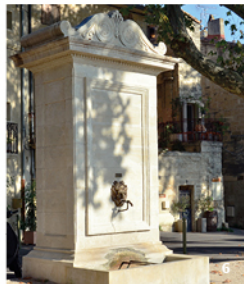
6. Fontaine du Portalet