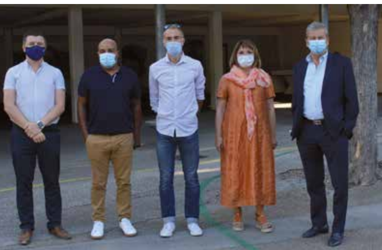
Rencontre avec le Directeur du groupe scolaire.