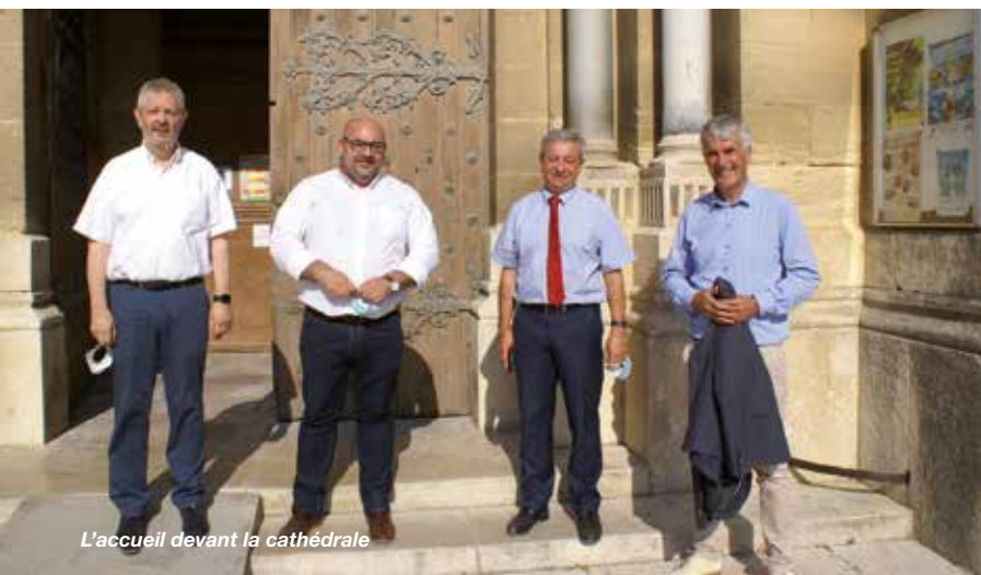
L'accueil devant la cathédrale