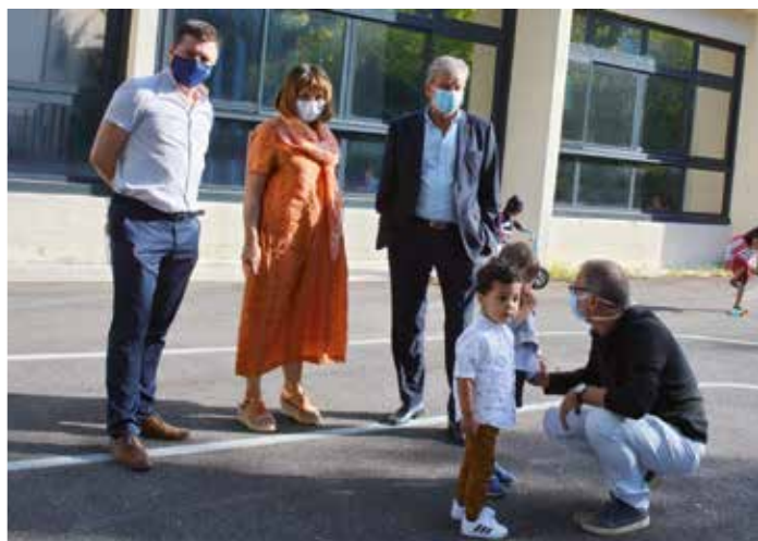
Rencontre avec le Directeur de l'école maternelle du Parc.