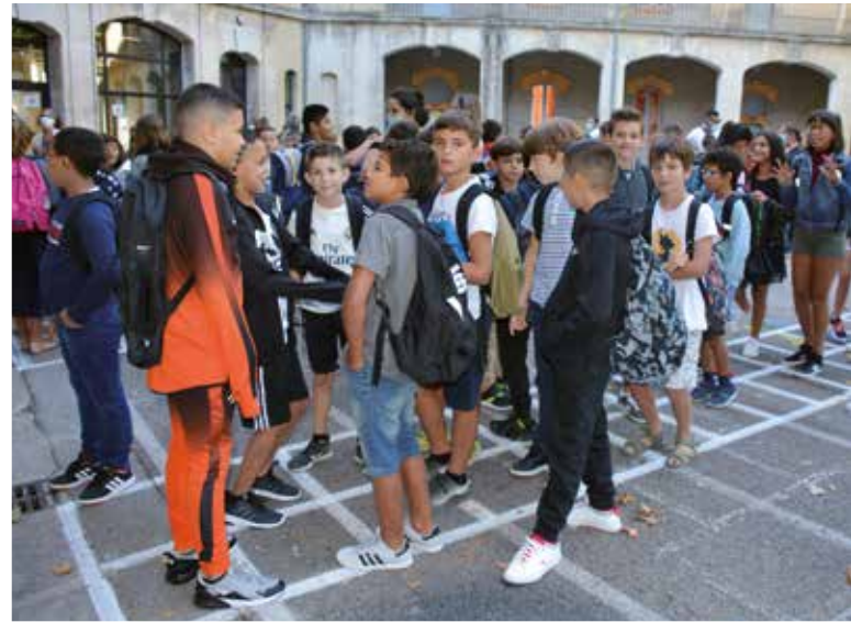
Au groupe scolaire Jean Macé.