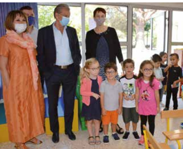
Dans les écoles maternelles publiques.