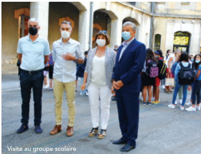
Visite au groupe scolaire

A l'école maternelle du Parc (71 élèves), grâce au soutien de l'association des parents d'élèves sont poursuivies des animations école/cinéma, médiathèque, animation musicale et, en partenariat avec l'Education nationale, est assuré un travail sur les oiseaux.