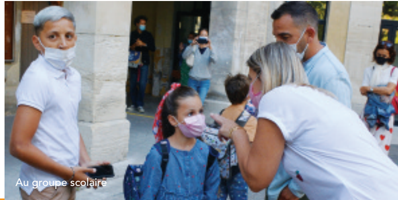
Au groupe scolaire