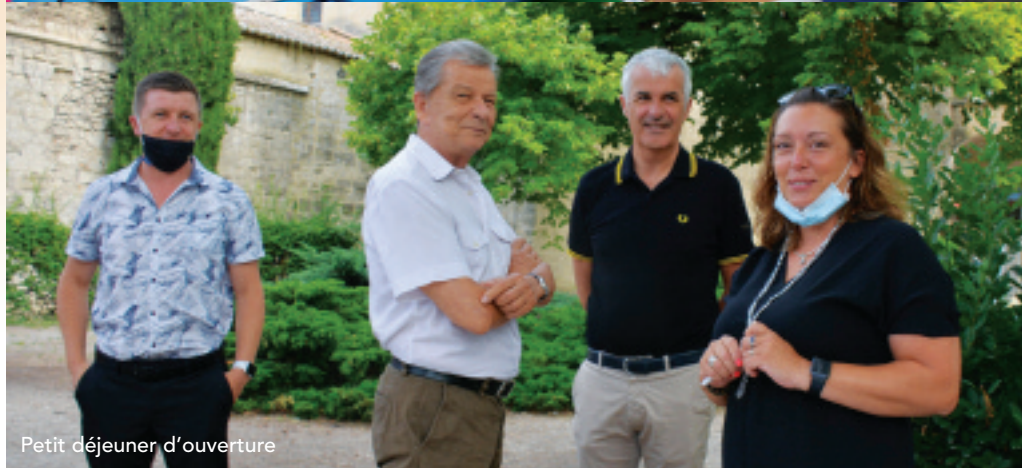
Petit déjeuner d'ouverture