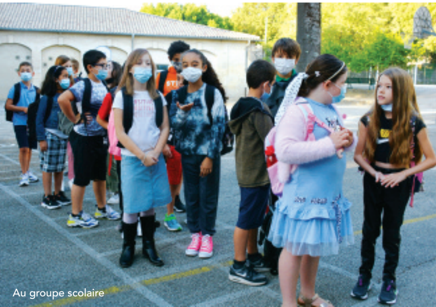
Au groupe scolaire