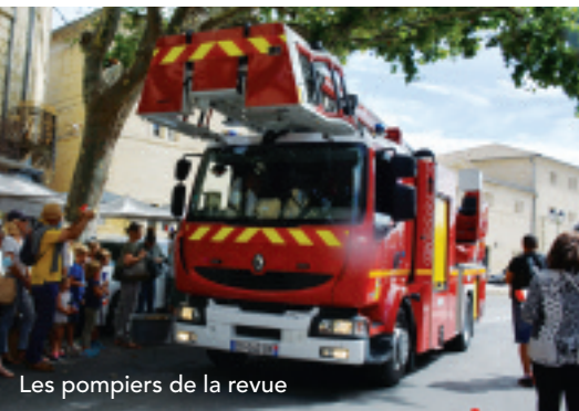
Les pompiers de la revue