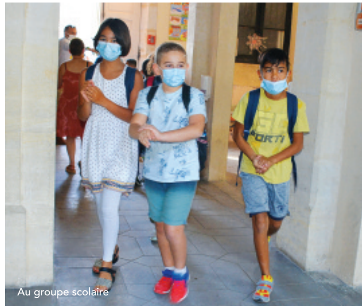
Au groupe scolaire