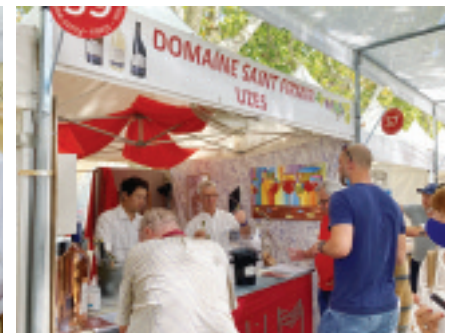
Le domaine Saint Firmin