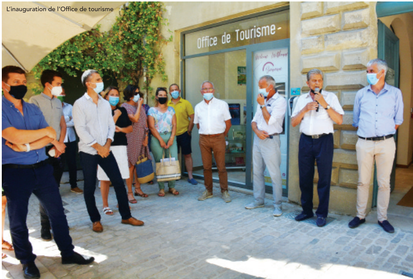
L'inauguration de l'Office de tourisme