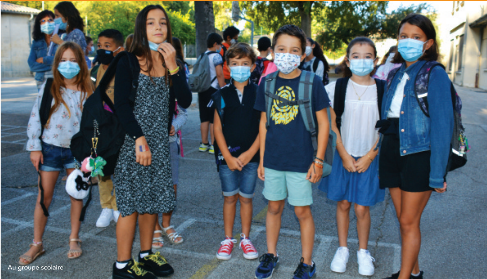
Au groupe scolaire