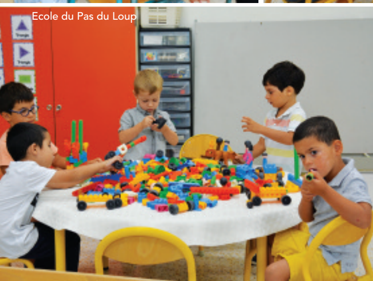
Ecole du Pas du Loup