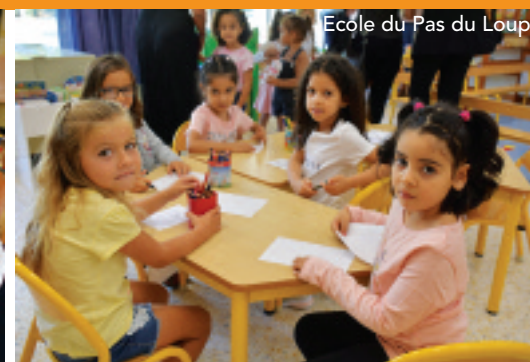
Ecole du Pas du Loup