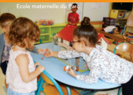
Ecole maternelle du Parc