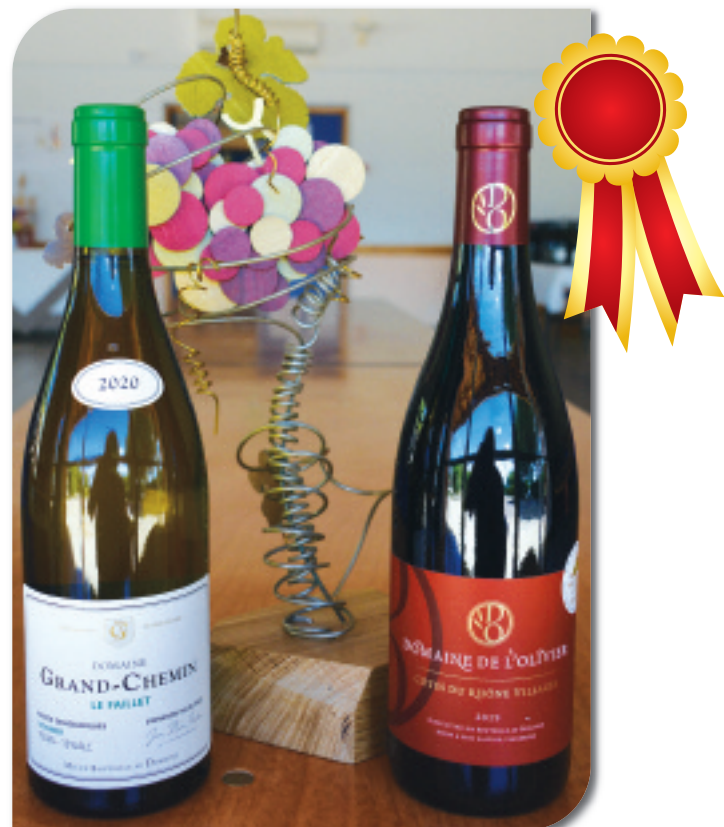
Les Prix d'Excellence