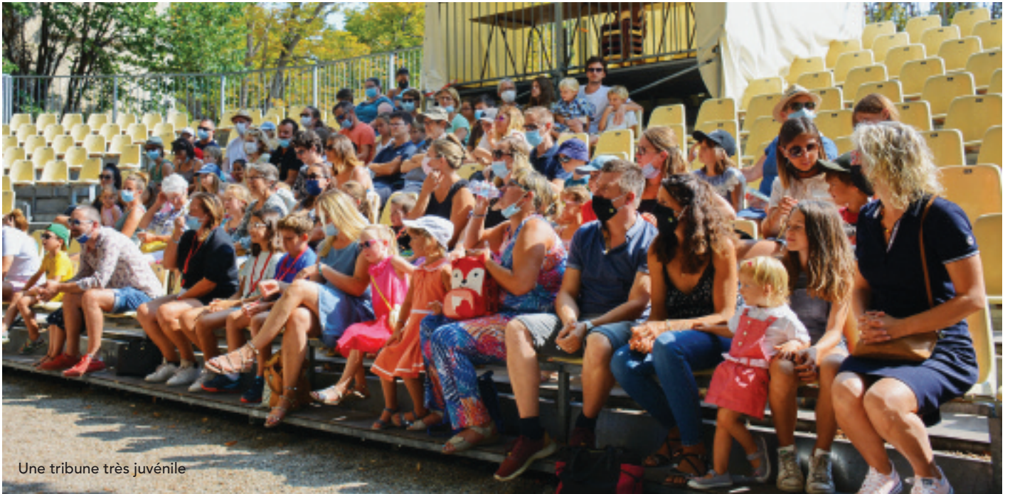
Une tribune très juvénile

Organisé dans le jardin de l'évêché, du 18 au 22 août, après les grands moments festifs que sont la fête votive puis la foire aux vins, le festival humour, théâtre et comédie, Uzès en scène #7, a conforté sa place dans les animations incontournables de l'été uzétien