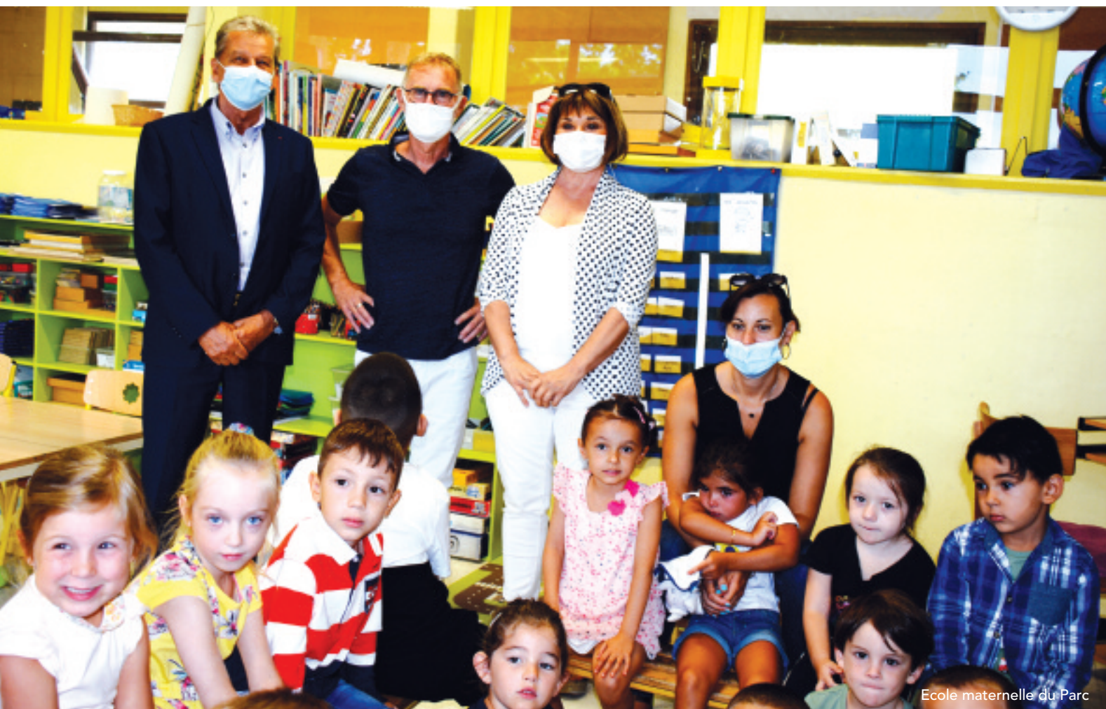
Ecole maternelle du Parc