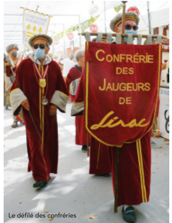
Le défilé des confréries

Tavel, Lirac, Côtes-du-Rhône, Côteaux du Languedoc, Costières de Nîmes, mais aussi vins IGP Pays d'Oc, Cévennes côteaux du Pont du Gard), mais de la cinquantaine d'exposants ayant, afin de mettre en valeur leur production, décoré d'objets divers très colorés leurs habituels stands blancs, tout en participant à un concours du plus beau stand remporté par le domaine St Firmin d'Uzès, devançant le domaine Chanoine Rambert de St André d'Olérargues, et le domaine Gilphine de Théziers.