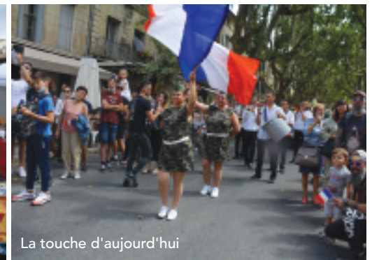
La touche d'aujourd'hui

assister à ce spectacle, fort apprécié par la population, d'un défilé d'un temps passé de souvenirs : des jeeps, des véhicules blindés, un char, des militaires en tenue, des tractions-avant avec le FFI de la Résistance. Un défilé déjà important complété par des majorettes, une musique militaire et les pompiers d'Uzès avec leurs véhicules rouges.