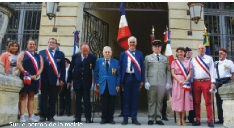
Sur le perron de la mairie

Un char Sherman arrêté devant l'hôtel de ville entouré d'un foule de badauds ? C'est ce que réservait mercredi 14 juillet, pour la fête nationale, le comité des fêtes qui avait invité Sud Véhicules de Montfrin à organiser un défilé rappelant la libération d'Uzès. Ce char de 33 tonnes en ordre de combat, construit à 50 000 exemplaires, est mû par un moteur de 8 cylindres en étoile de 380 CV, qui consomme 400 litres d'essence à l'heure, qu'il transporte dans 5 réservoirs pour un total de 1500 litres. Il a donc une autonomie d'un peu moins de 4 heures. Il est muni de 3 canons et pouvait tirer des ogives perforantes, des ogives à fragmentation, des ogives au phosphore. Autant d'atouts pour les vainqueurs !