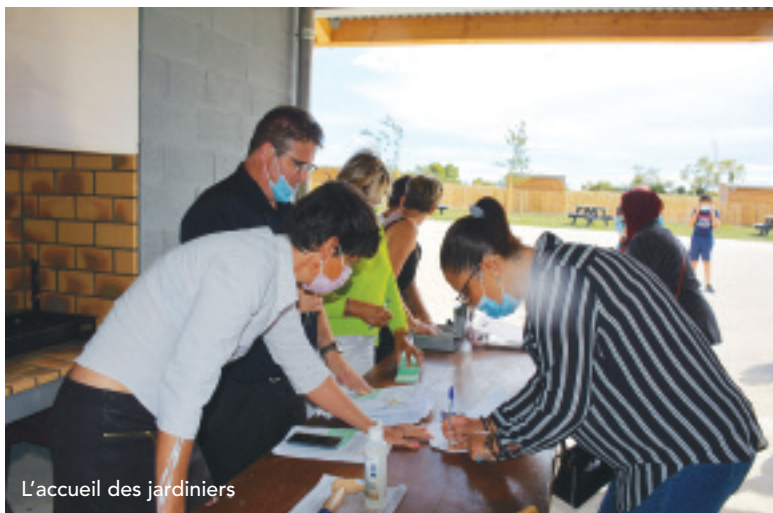
L'accueil des jardiniers

Pour le meilleur aspect possible de l'ensemble des jardins, chaque jardinier participe à l'entretien des parties communes : abris communs, allées, dégagements... et apporte à l'association quelques heures de son temps selon un planning bien défini.