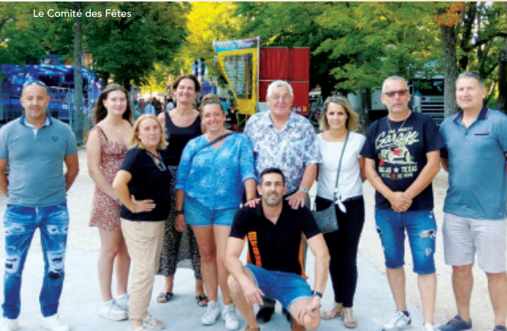
Le Comité des Fêtes