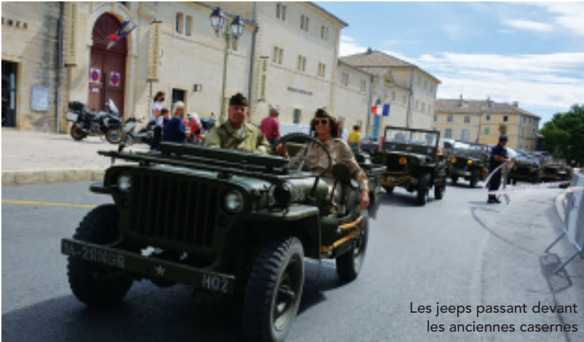
Les jeeps passant devant les anciennes casernes