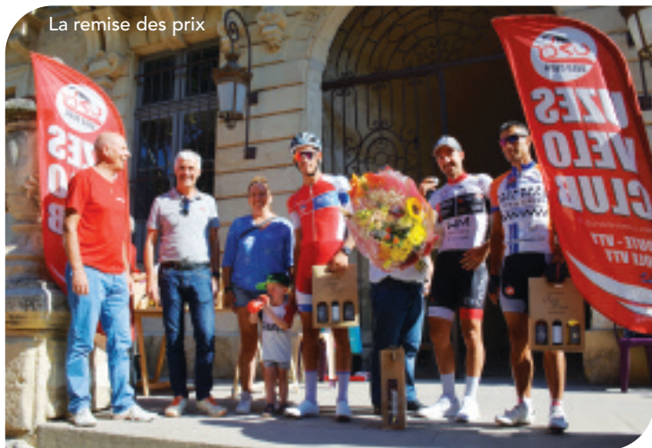
La remise des prix

circuit, en partie à l'ombre, mêlant faux-plats très roulants et passages pentus plus étroits, mais parfaitement sécurisé par les services municipaux.