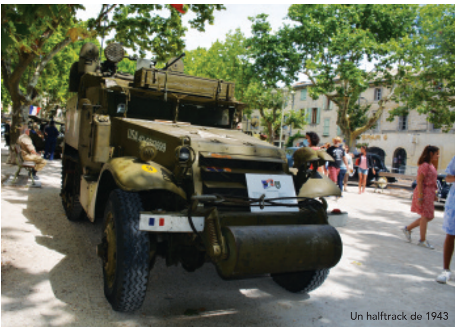
Un halftrack de 1943

Certes la fête nationale débute depuis des années pour le comité des fêtes, la veille, c'est-à-dire le 13 juillet, avec dès le mardi, antiquaires et brocanteurs qui s'installent sur la promenade des Marronniers. Leur présence, en bon ordre, se transforme rapidement en paradis des chineurs en tous genres en quête de l'objet désiré. C'est aussi l'occasion pour les curieux de prendre un bain de souvenirs que les exposants n'hésitent pas à enrichir.