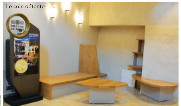
Le coin détente