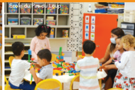
Ecole du Pas du Loup