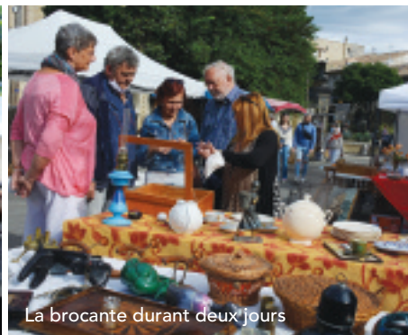
La brocante durant deux jours