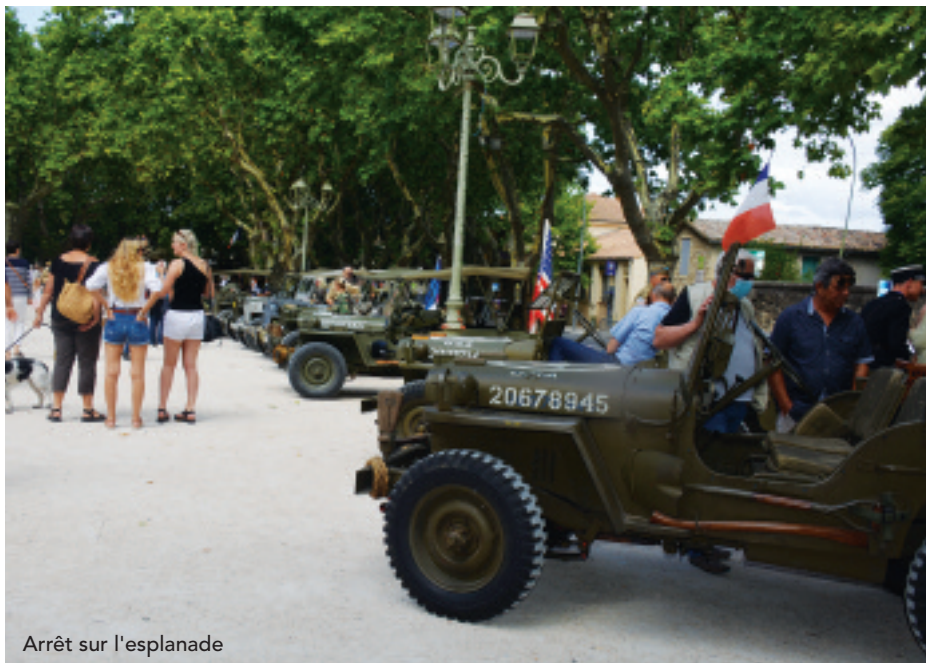
Arrêt sur l'esplanade