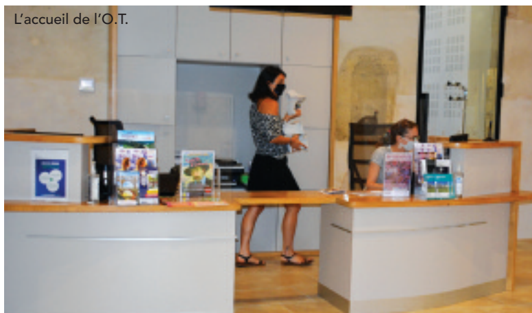
L'accueil de l'O.T.

un total de 650 000 €, bénéficiant de subventions de la Région Occitanie dans le cadre du plan "Grand site d'Occitanie" et une participation de la ville d'Uzès, propriétaire des lieux dont elle a assumé la réfection de la toiture .