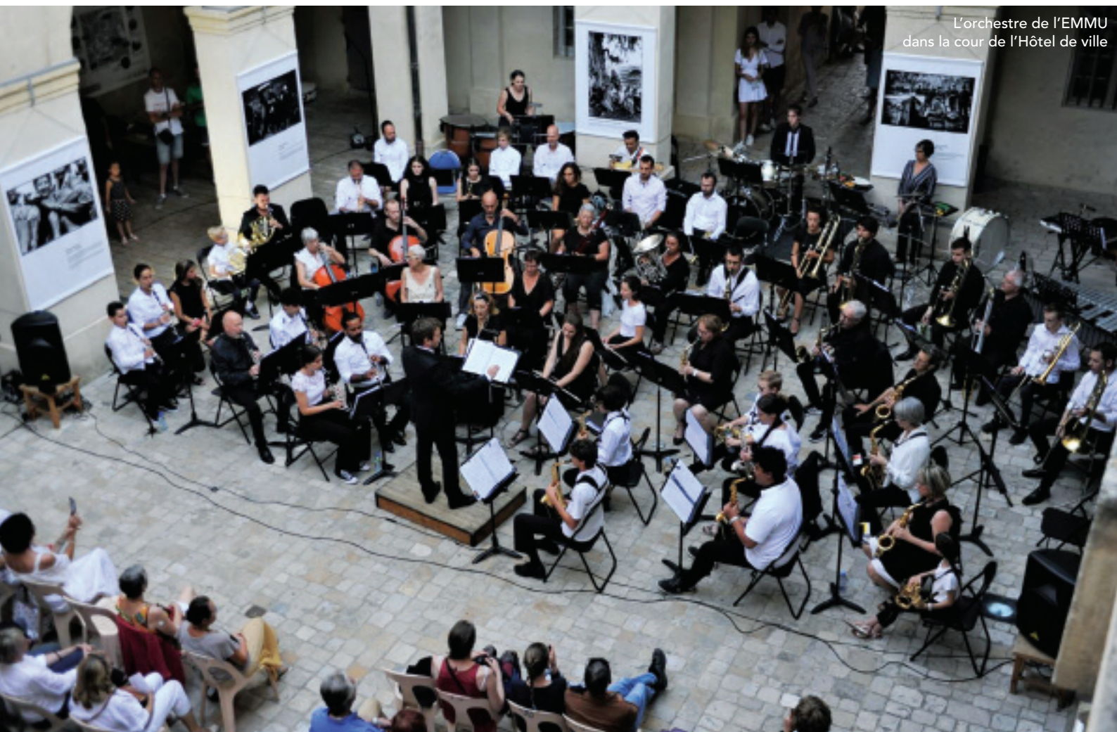
L'orchestre de l'EMMU dans la cour de l'Hôtel de ville