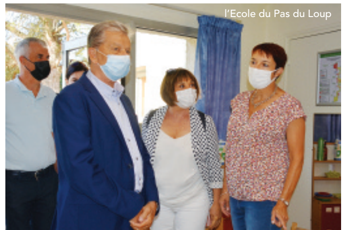
L'Ecole du Pas du Loup