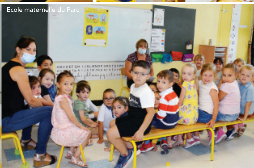
Ecole maternelle du Parc