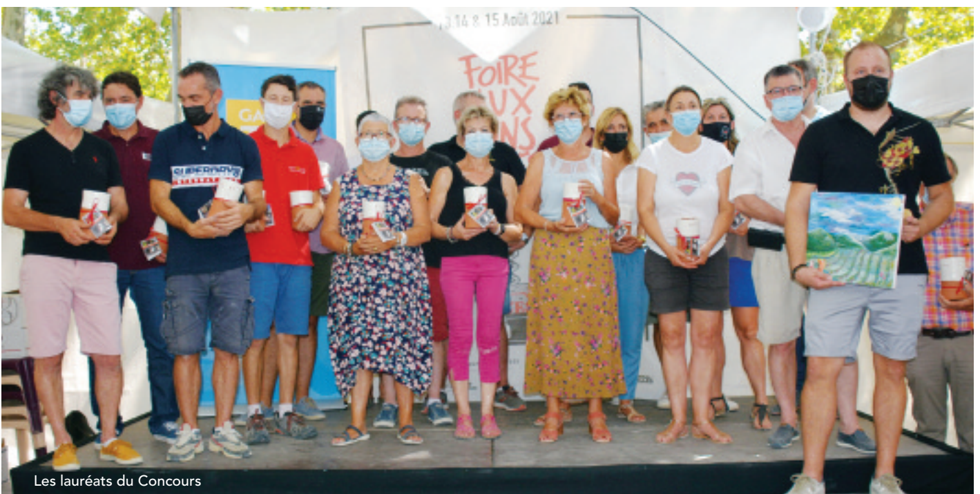
Les lauréats du Concours