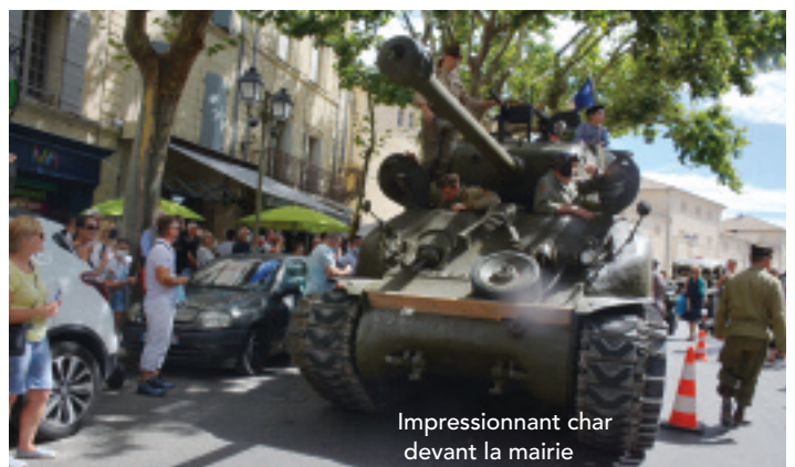
Impressionnant char devant la mairie