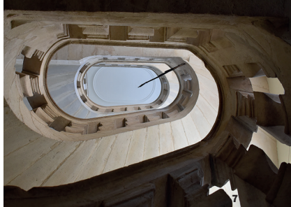
7 - Escalier ovale. Hôtel Danger