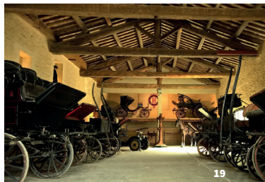
19. Salle des attelages