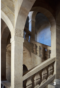
3. Escalier à 4 noyaux