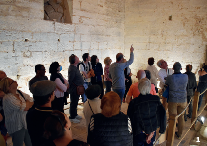
1. Visite guidée de la ville