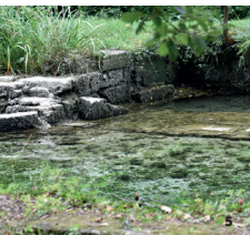
5. Source d'Eure