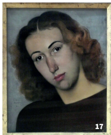
17. Portrait de Catherine Gide par Bussy © Musée Georges Borias - Ville d'Uzès