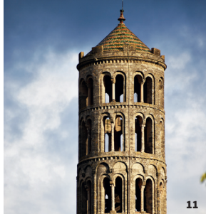
11. Tour Fenestrelle