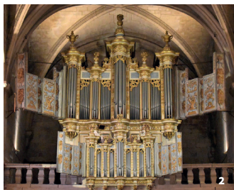
2. Orgues de la cathédrale St Théodorit