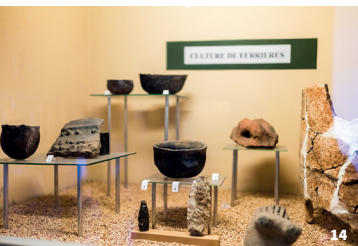
14. Musée Georges Borias