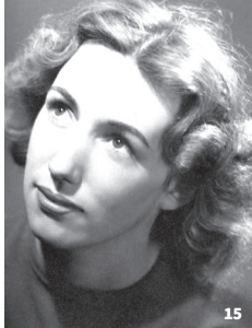
15. Catherine Gide