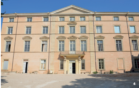
4. Ancien évêché