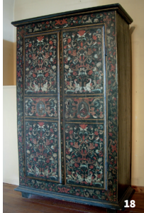
18. Armoire peinte du 18 e s.