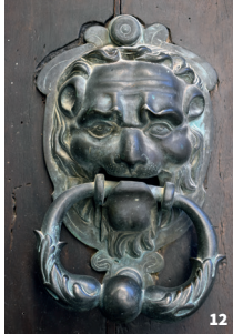
12. Heurtoir du 18 e s.