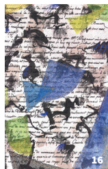
16. Suite racinienne © Michel Danton