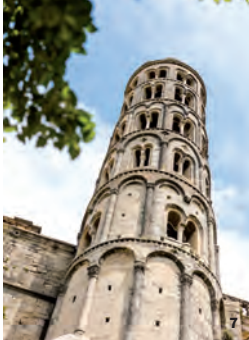
7. Tour fenestrelle