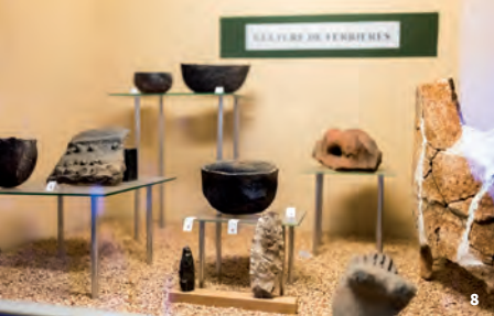
8. Musée Georges Borias