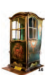
16. Chaise à porteur