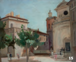
15. St-Etienne par Fernand Siméon