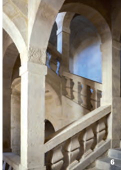
6. Escalier à 4 noyaux