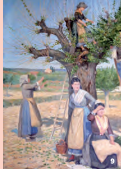
9. Les magnanarelles d'Uzès, tableau de Georges Belon, musée G. Borias