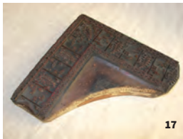
17. Planche d'impression