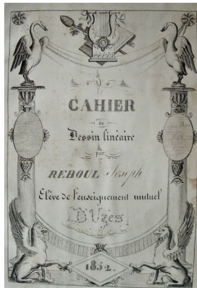
Dessin d'un élève de l'Ecole d'enseignement mutuel d'Uzès, daté de 1852