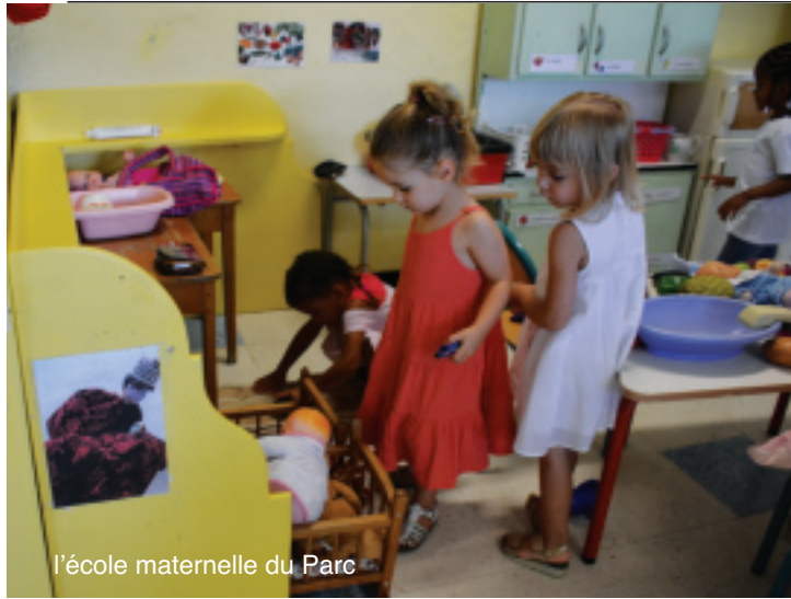
l'école maternelle du Parc