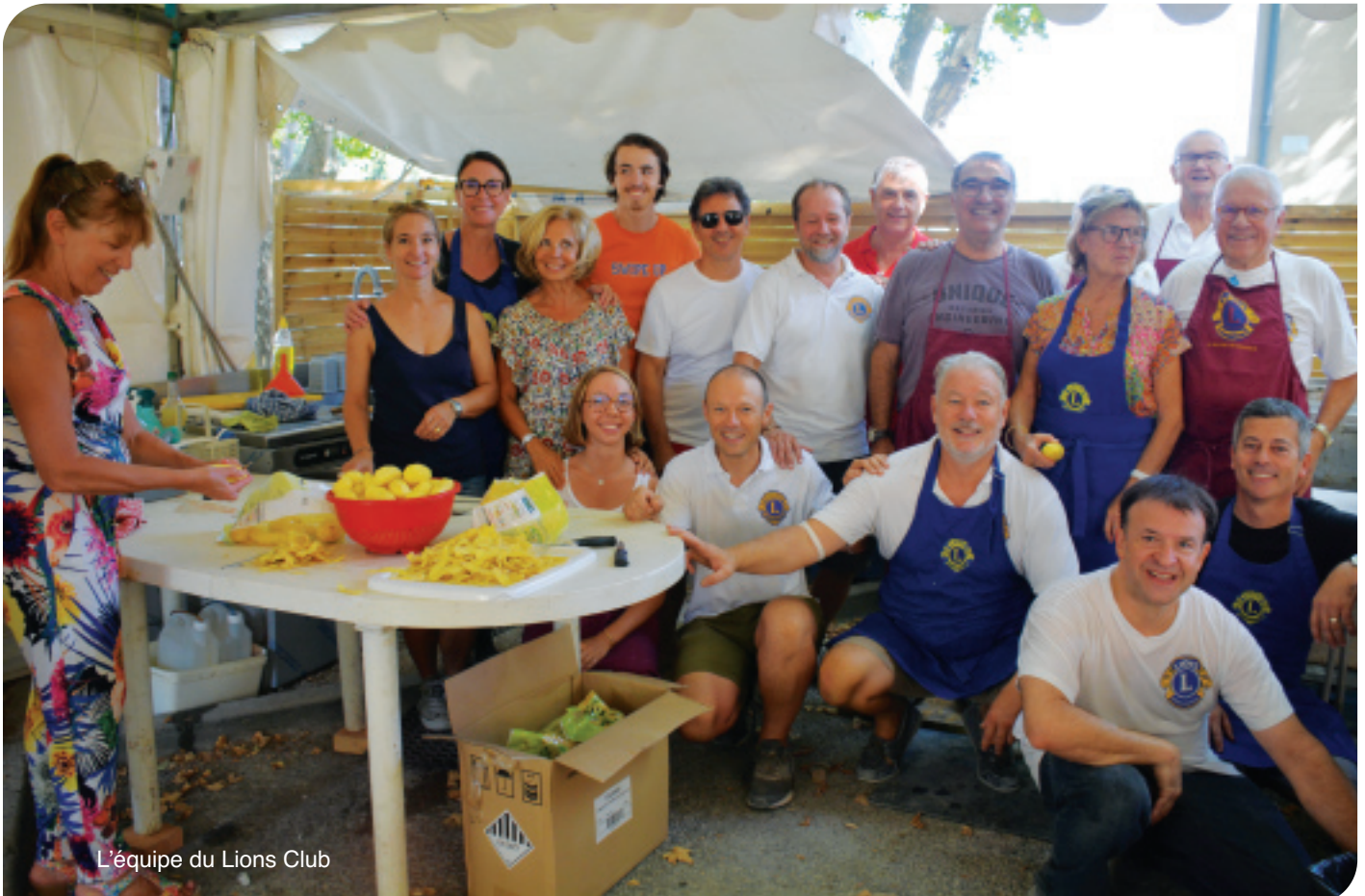
L'équipe du Lions Club

Après deux années blanches à cause du Coronavirus, la foire aux vins a connu sa 47 ème édition les 12, 13, et 14 août selon son processus bien rodé débutant par la remise des récompenses aux lauréats du concours, le prix d'excellence étant attribué pour la catégorie AOP Duché d'Uzès rouge aux Côteaux Cévenols (cave de Durfort) pour sa cuvée Persévérance 2019 et, pour la catégorie IGP Cévennes, au Domaine de la Vallère pour sa cuvée Rendez-vous 2021 .