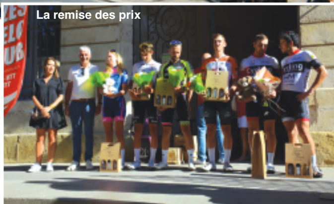
La remise des prix

Il suffisait d'éviter la chute pour voir le Spiripontain inscrire à nouveau son nom au palmarès du grand prix cycliste d'Uzès, avec une moyenne de 42,34 km/h, malgré une forte chaleur, sur un parcours parfaitement sécurisé par le personnel municipal.