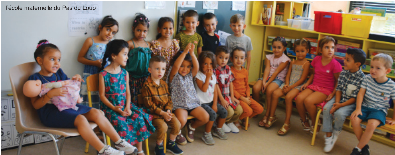
l'école maternelle du Pas du Loup