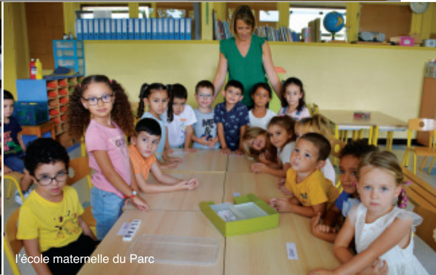
l'école maternelle du Parc