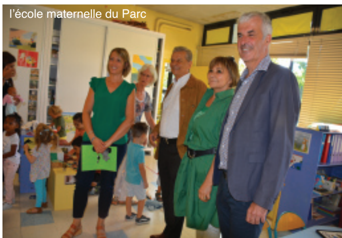
l'école maternelle du Parc