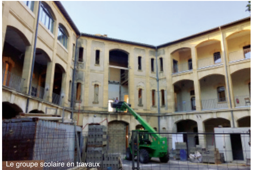
Le groupe scolaire en travaux

Enfin, à l'école maternelle du Pas du Loup, un peu excentrée, car se trouvant au quartier des Amandiers, la vie s'écoule sous la direction d'Ingrid Clergue, pour les 46 élèves (2 classes), en s'inscrivant dans la continuité d'une année passée, marquée par une pédagogie coopérative.