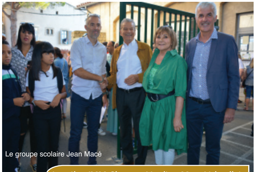
Le groupe scolaire Jean Macé