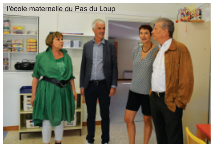
l'école maternelle du Pas du Loup