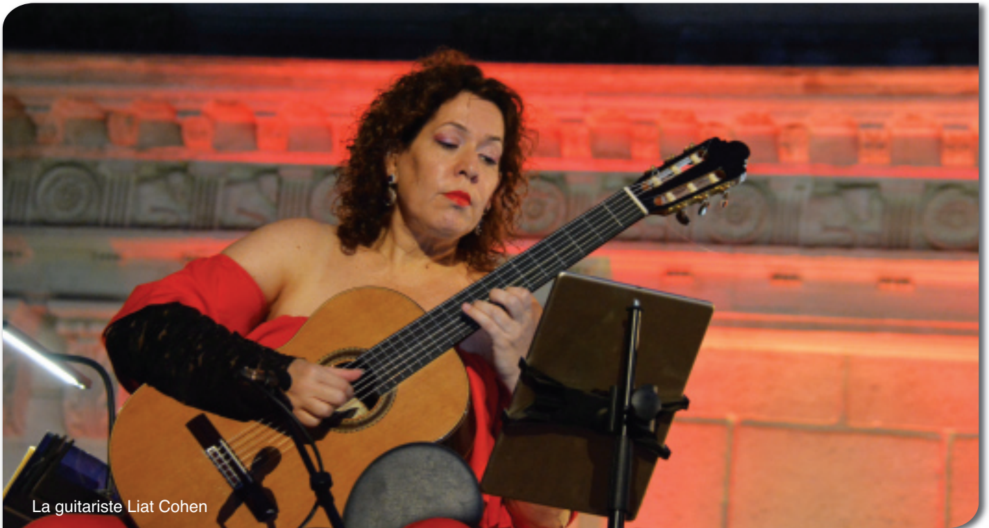
La guitariste Liat Cohen

D epuis 1970, Les Nuits Musicales offrent un bel itinéraire à travers les musiques anciennes et baroques jouées sur instruments d'époque, au cœur des édifices historiques de la cité ducale.