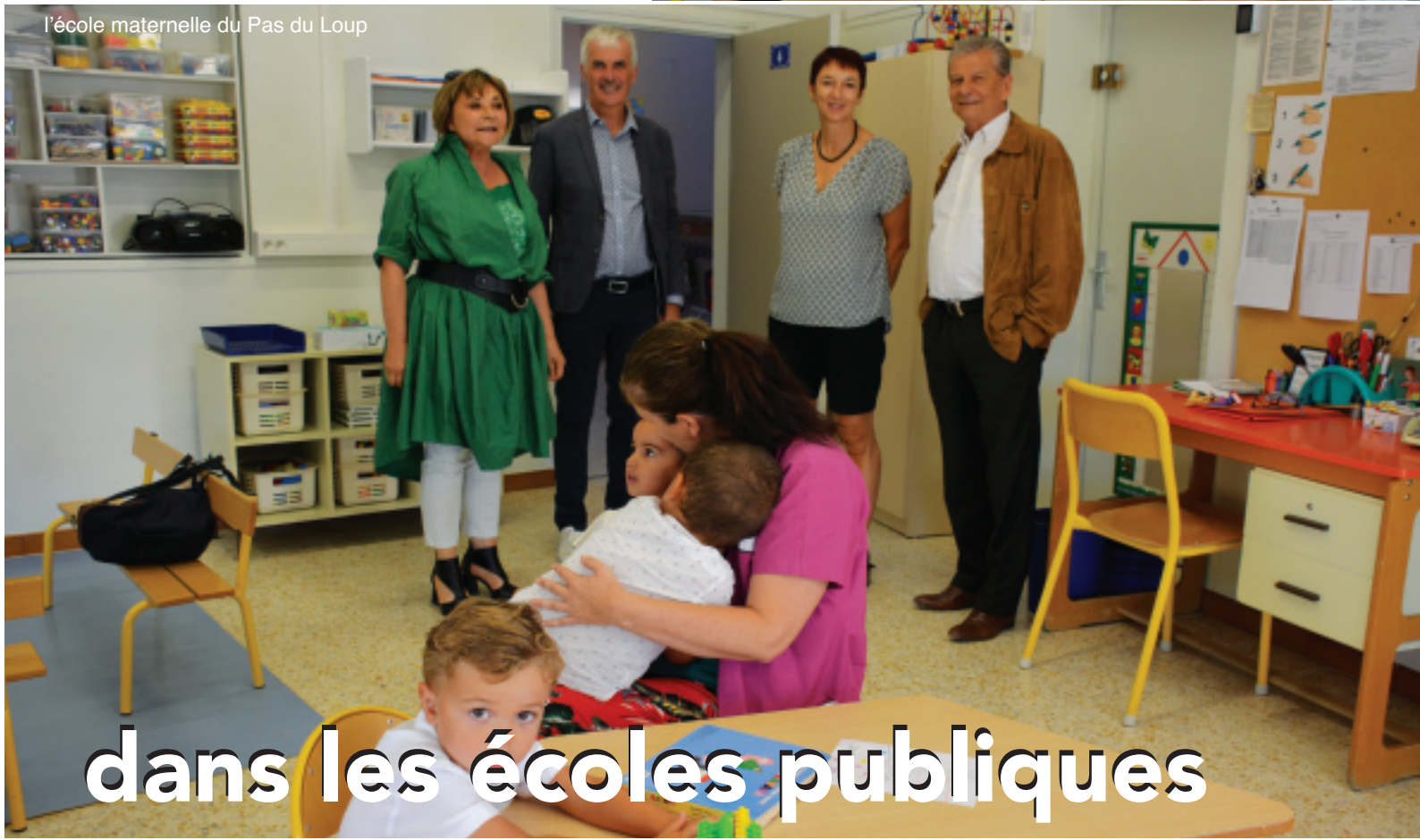
l'école maternelle du Pas du Loup