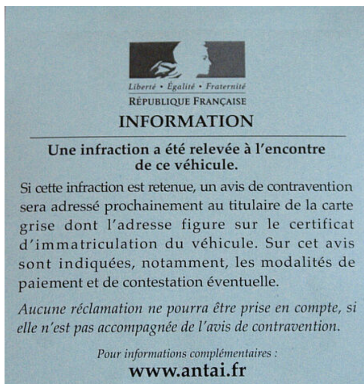
Avis de verbalisation (information)

Depuis le 22/11/2017, la verbalisation papier pour toute infraction commise sur la commune d'Uzès se transforme en PV électronique. Comment ça marche ? Publié le 16/11/2017.