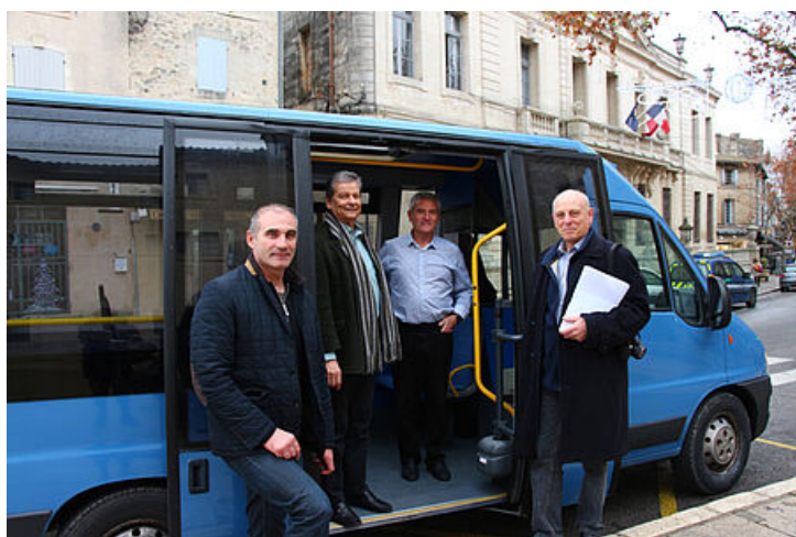
Navette gratuite tous les samedis de 9h à 13h

La navette gratuite du samedi permet de desservir les quartiers et les points stratégiques de la ville.