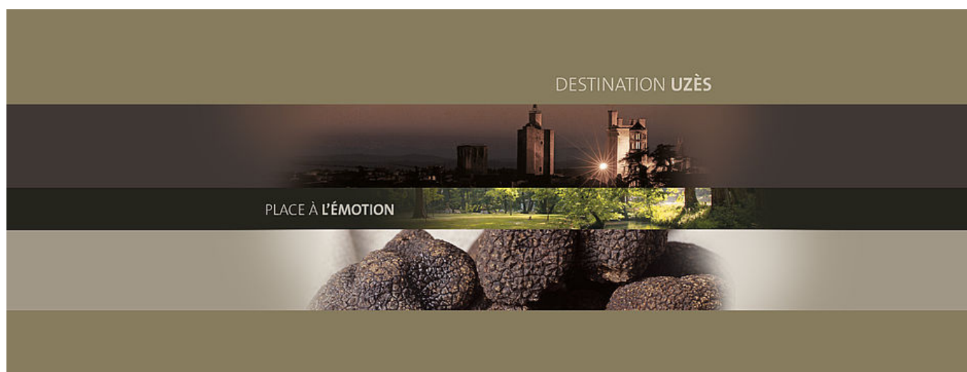
Destination Uzès : place à l'émotion

Composez votre séjour selon vos envies... Publié le 06/03/2020