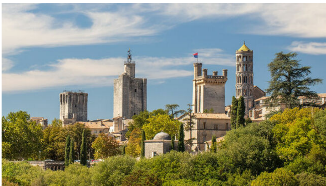
Les trois pouvoirs médiévaux d'Uzès, symbolisés par les trois tours. De gauche à droite : la tour du roi, la tour de l'évêque et la tour ducale, appelée aussi tour Bermonde.

La Ville d'Uzès obtient le label « Ville d'Art et d'Histoire » en novembre 2008. Une convention signée entre le ministère de la Culture et de la Communication et la Ville d'Uzès officialise ce partenariat fort qui souligne la volonté de la ville de promouvoir la qualité architecturale et paysagère de son patrimoine.