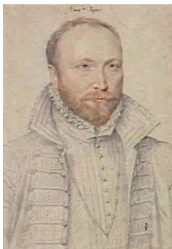
Antoine de Crussol

Entre service du roi et ambition personnelle, entre protestantisme et catholicisme, cette conférence vous invite à comprendre le parcours mouvementé du premier duc d'Uzès.