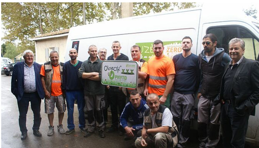
Les élus et employés municipaux d'Uzès réunis autour du label "Terre Saine", Objectif Zéro phyto (pesticides), bien mérité après trois ans de nouvelles pratiques en ville.

Le 15 octobre 2019 à Toulouse, deux représentants de la Ville d'Uzès, élu et directeur des services techniques, ont reçu au nom d'une équipe le label "Terre saine", décerné par la Fredon Occitanie, en partenariat avec la Région, dans le cadre de la démarche environnementale volontaire "Objectif Zéro Phyto".