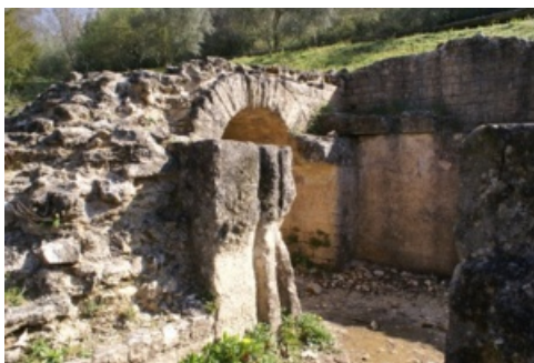
Vestiges de l'aqueduc romain, vallée de l'Eure, Uzès.

Au 1 er siècle de notre ère, Nîmes, la Colonia Augusta Nemausensis, manquait d'eau pour se doter d'équipements dignes de son statut de grande ville. Il fallait donc la lui apporter en construisant un aqueduc. Le choix des concepteurs romains s'est porté sur la source d'Eure, sur le site de la ville d'Uzès.