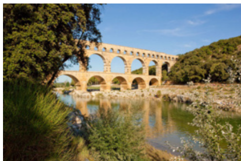
Uzétiens : demandez votre accès gratuit au Pont du Gard.

La carte Ambassadeur, valable trois ans , donne à chaque famille, jusqu'à 5 personnes par visite, un accès illimité sur une année :