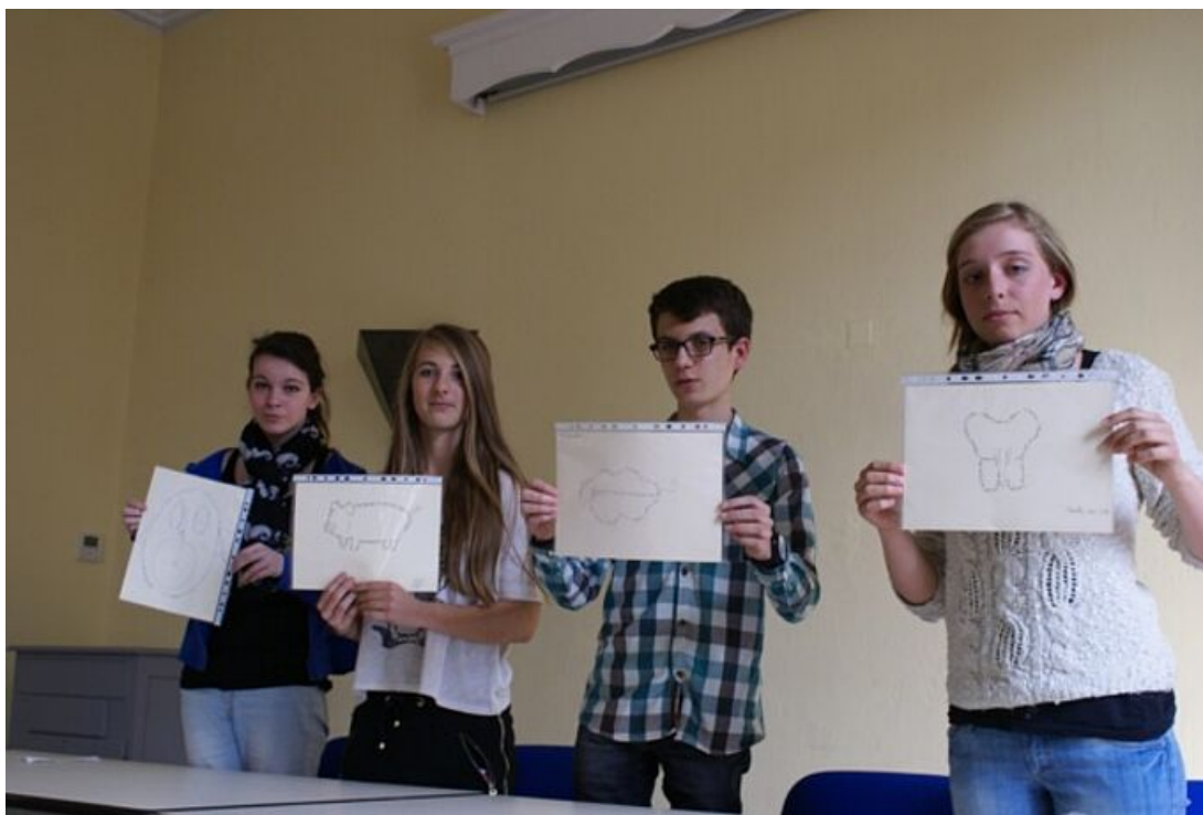
Les élèves de 2nde du lycée Charles Gide d'Uzès font leurs printemps des poètes en revisitant Max Jacob

"Si la poésie a toujours eu un lien étroit et naturel avec les arts premiers que sont le chant, la danse et le théâtre, elle est aussi souvent l'arrière-pays, le moteur secret ou le point d'appui de la création dans les arts plastiques, la photographie, la composition musicale, le court-métrage cinématographique, la vidéo, voire le cirque..." ainsi s'exprime le directeur artistique, Jean-Pierre Siméon du 16e Printemps des poètes soutenu par les ministères de la Culture et de la Communication, via le Centre national du Livre, et le ministère de l'Éducation nationale.