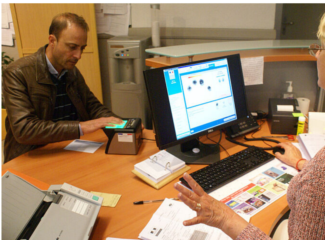
Uzès délivre désormais les passeports et cartes d'identités biométriques

La mairie d'Uzès est désormais équipée du matériel permettant de délivrer le passeport et/ou la carte d'identité biométriques pour la commune et celles qui sont limitrophes.