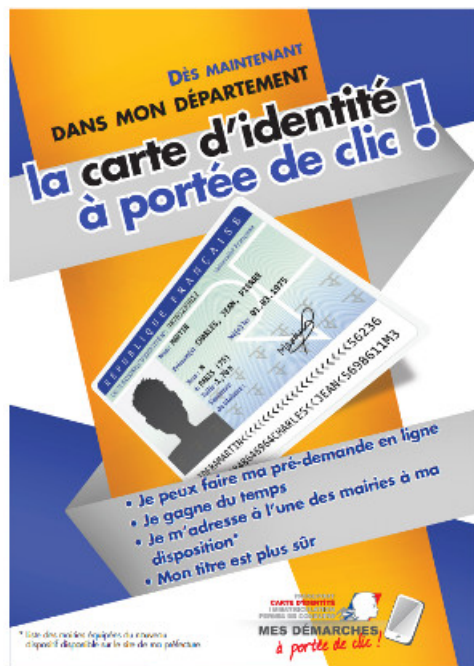
La carte nationale d'identité, CNI biométrique en un clic

Une démarche simplifiée à l'aide du formulaire de pré-demande est désormais disponible sur le site passeport.gouv.fr ou sur www.service-public.fr .