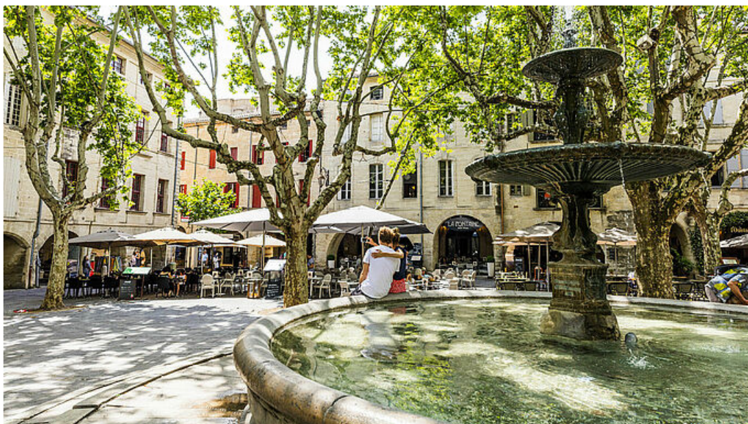
Le place aux herbes accueille tous les mercredis et samedis les marchés colorés de l'été. Producteurs le mercredi et tous produits le samedi.

Les passionnés des visites guidées du patrimoine retrouveront sur Uzès les incontournables du label Ville d'art et d'histoire, grâce à la nouvelle programmation culturelle municipale qui vient de sortir pour l'été, dès le 1er juillet 2020. Comme un heureux événement, très attendu pour le patrimoine Uzétien, les Rendez-vous Uzès tiennent leurs promesses !