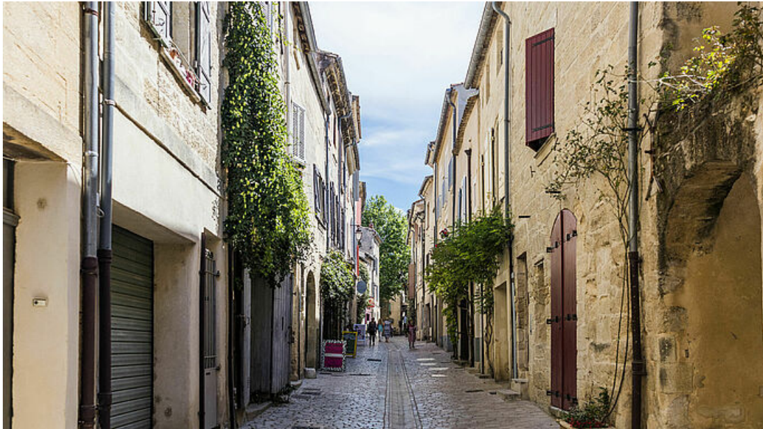
Les faubourgs de la ville, nouveauté de la saison.

La nouveauté de la saison propose une visite consacrée aux faubourgs de la ville . Au-delà des anciens remparts de la ville, se trouvaient les faubourgs du Masbourguet au nord et des Bourgades au sud-ouest . Cette « Ville neuve » se développe à partir du XVII e siècle, à la faveur du renouveau des industries de la serge et de la soie. De cette période d'intense activité, les faubourgs conservent une cohérence architecturale qui leur donne aujourd'hui ce charme si particulier