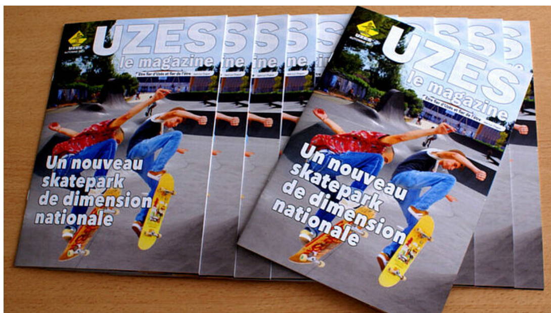
Uzès, le mag de l'automne est sorti.

Le nouveau numéro du magazine d'information de la municipalité vient de paraître. Vous le trouverez à partir de ce mercredi 22 septembre 2021 dans vos boîtes aux lettres et dès à présent sur le site de la Ville dans la rubrique "ma mairie", magazine publication, publication et en Une du site internet dans "A lire" .