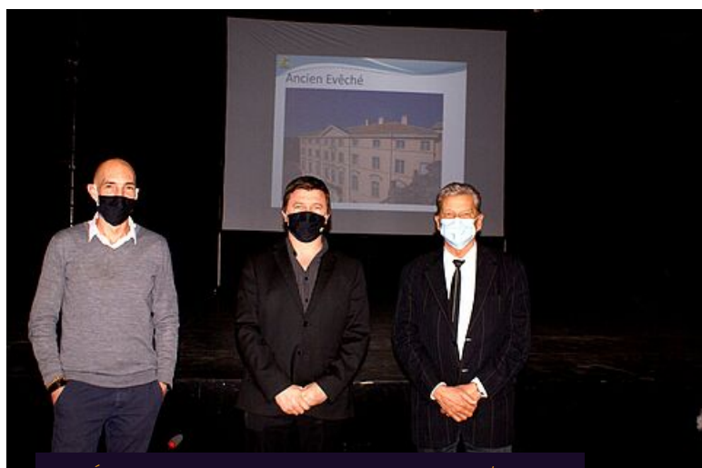
AMÉNAGEMENT, INITIATIVES, PROJETS, TRAVAUX/VOIRIE