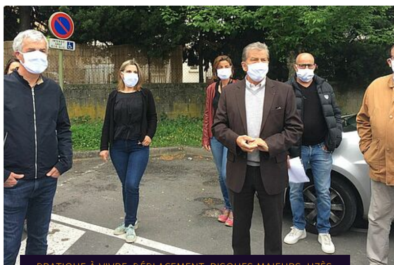
PRATIQUE À VIVRE, DÉPLACEMENT, RISQUES MAJEURS, UZÈS