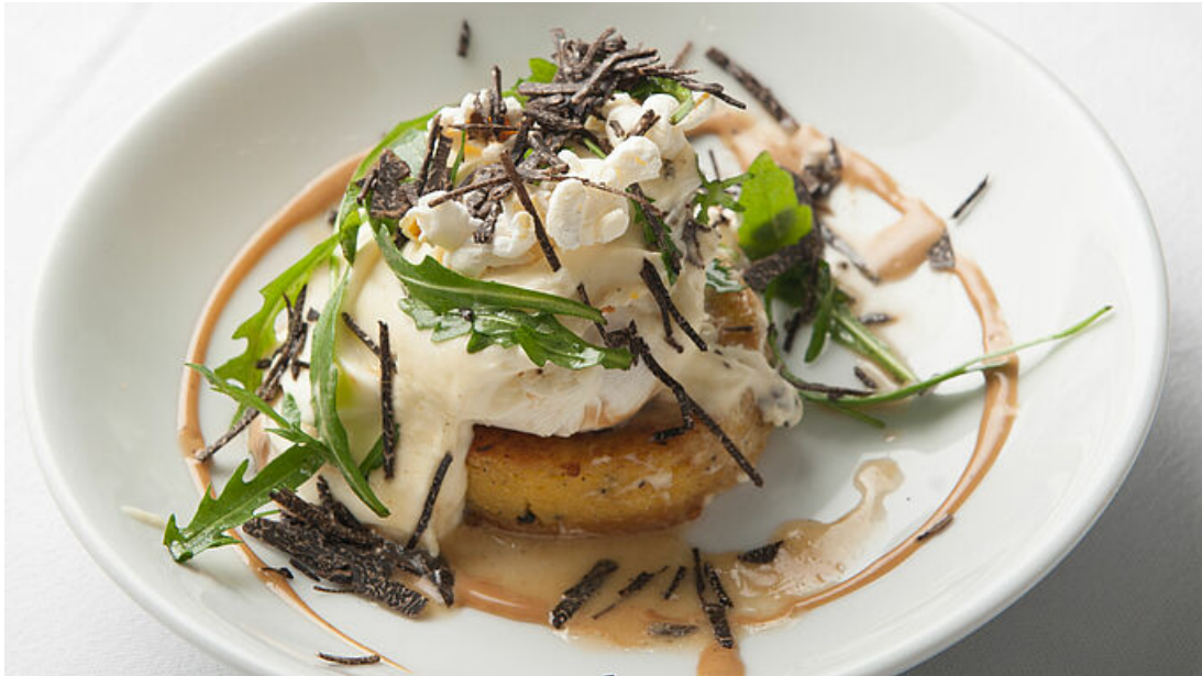
Plats à emporter à commander auprès des restaurateurs participants.

noire est plus précoce au niveau de la maturité, plus odorante et goutteuse." Quelques grammes de truffe suffisent pour préparer une bonne brouillade pour quatre personnes.