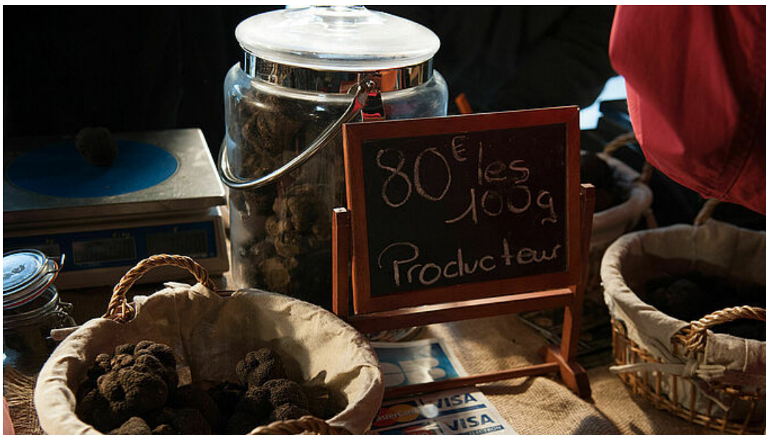
Journée de la truffe à Uzès, dimanche 31 janvier de 9h à 16h.

Après la première journée de la truffe du 17 janvier consacrée au diamant noir, une seconde édition se prépare activement ce dimanche 31 janvier 2021 de 9h à 16h , sur la place aux Herbes à Uzès où plusieurs kilos de truffes noires seront proposés à la vente .