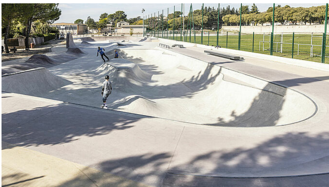
Un nouveau skatepark de 1892 m 2 pour développer les sports de glisse urbains, inauguré le 3 juillet 2021, sur le complexe sportif André Rancel.

Uzès innove avec un skatepark dernière tendance. Inaugurée en juillet dernier, sur le complexe sportif André Rancel, il offre tous les atouts d'un lieu tendance, multi-pratiques et multi-générationnel pour tous les sports de glisse urbaine.