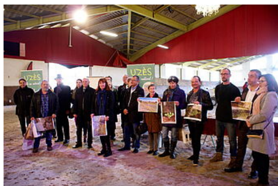
L'ensemble des lauréats du premier concours photo Uzès, Zéro Phyto. Un autre regard sur les sauvages de ma rue.

Vingt-et-une personnes ont participé au défi photos lancé par la Ville d'Uzès pour valoriser la démarche environnementale Zéro Phyto.