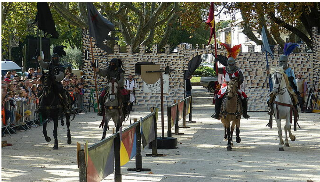
Les Médiévales d'Uzès, 24 et 25 octobre 2020 à Uzès

Oyé Oyé, Préparez vous, la nouvelle édition des Médiévales d'Uzès arrive les samedi 24 et dimanche 25 octobre 2020 ! Entre chevalerie et fauconnerie, cavaliers et troubadours, le programme proposé par l'association des commerçants Les Dynamiques d'Uzès est complet. Animations, spectacles, découvertes, marchés, et visite guidée attendent petits et grands. Venez découvrir une autre époque dans un cadre d'exception, la cité ducale et pourquoi pas vous déguiser pour l'occasion ? "Il s'agissait d'une demande de la population et des commerçants" rappelait la présidente de l'association. Refaire l'histoire sur deux jours est de nouveau la défi relevé par toute l'équipe. Le défilé d'ouverture du samedi 24 octobre à 11h où tout le monde peut être costumé grâce à la location sur place de déguisements (samedi de 10h à 18h, à la mairie, à partir de 10 € le déguisement).