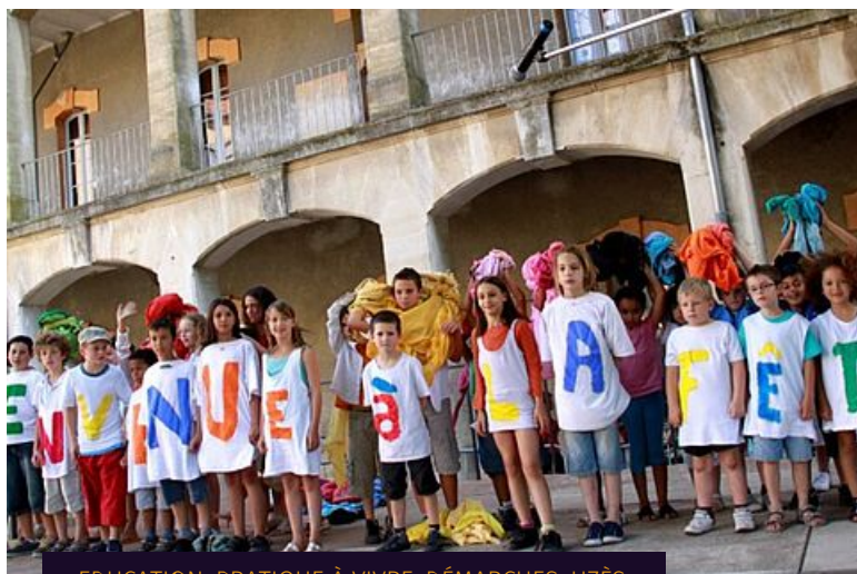
EDUCATION, PRATIQUE À VIVRE, DÉMARCHES, UZÈS

La Ville d'Uzès informe ses habitants que les bureaux de votes passent de 5 à 8 pour les élections municipales.