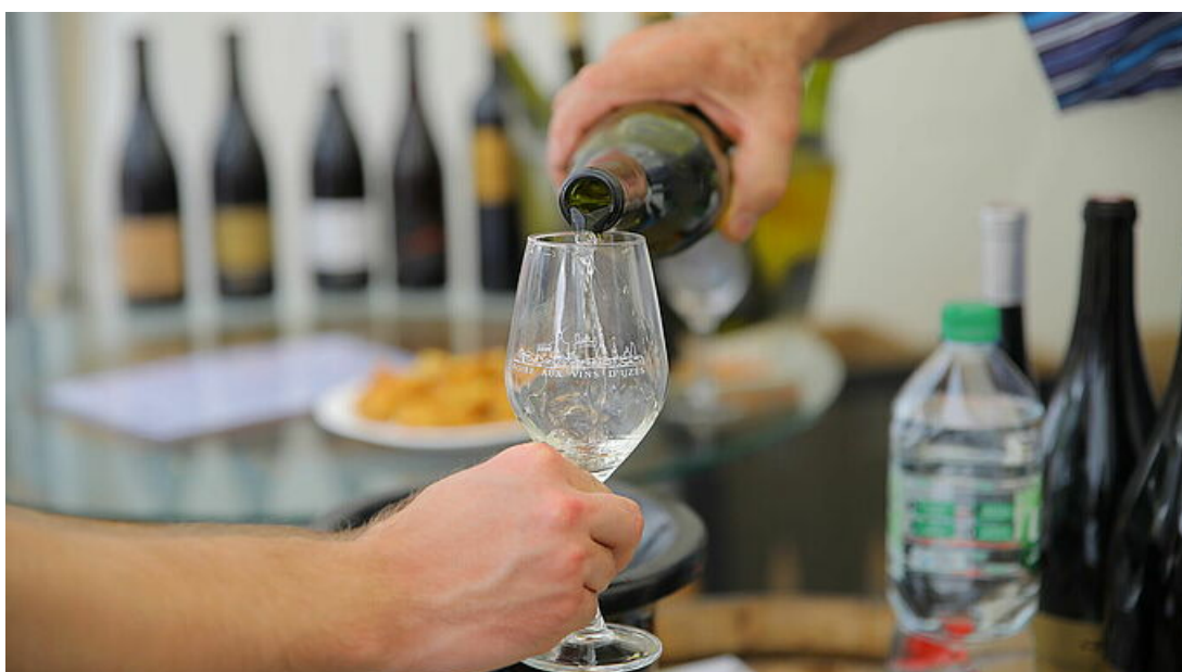
Foire aux vins, Uzès