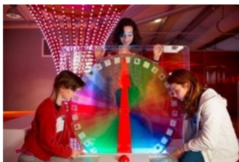
Nouveauté : les manipulations mécaniques et multimédia inspirées de la fabrication du célèbre bonbon

A découvrir désormais, de nouvelles manipulations mécaniques et multimédia, inspirées de la fabrication du célèbre bonbon.