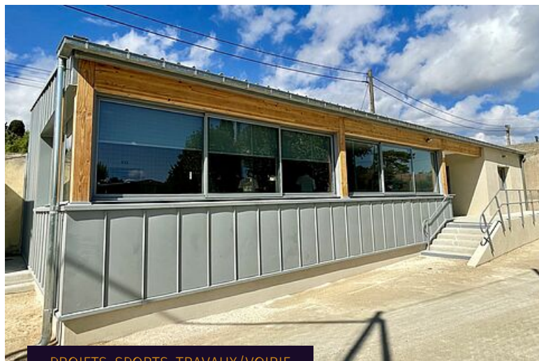
PROJETS, SPORTS, TRAVAUX/VOIRIE