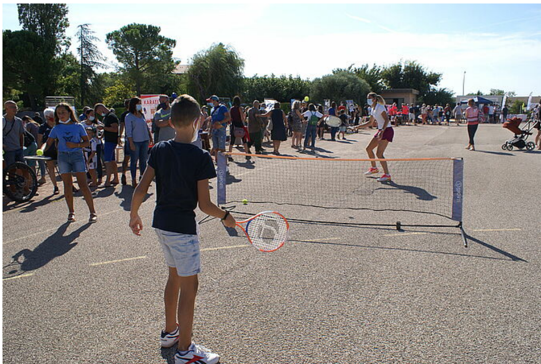
Démonstration de tennis

Les associations donneront à chacun une idée de ce qu'il sera possible de découvrir et les nouveautés de la rentrée. Le terreau associatif uzétien compte environ 150 associations. Tous les publics sont concernés, petits et grands pour satisfaire toutes les envies et découvrir de nouvelles activités seul ou en famille.