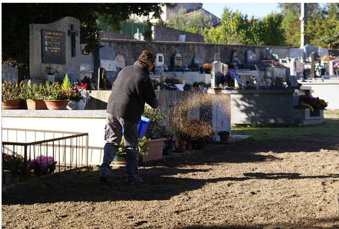
Enherbement d'une zone test du cimetière d'Uzès, le 7 décembre 2018

La démarche environnementale sans pesticides, initiée par la Ville en 2016, prévoit un plan d'actions qui permet de considérer les espaces verts publics de manière raisonnée. Désormais, la biodiversité est privilégiée pour permettre à l'environnement d'être préservé. "La végétation spontanée se développe naturellement sur un site ou les accotements de voirie. Le contrôle s'effectue par fauchage ou par tonte à des moments clés de l'année" explique Alex Wasselin, responsable du centre technique municipal d'Uzès.