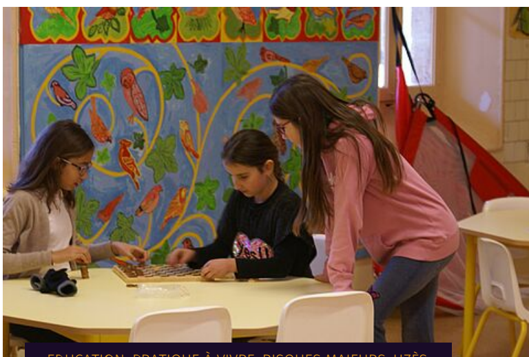
EDUCATION, PRATIQUE À VIVRE, RISQUES MAJEURS, UZÈS