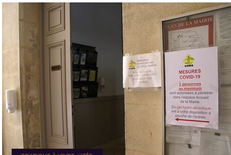
PRATIQUE À VIVRE, UZÈS