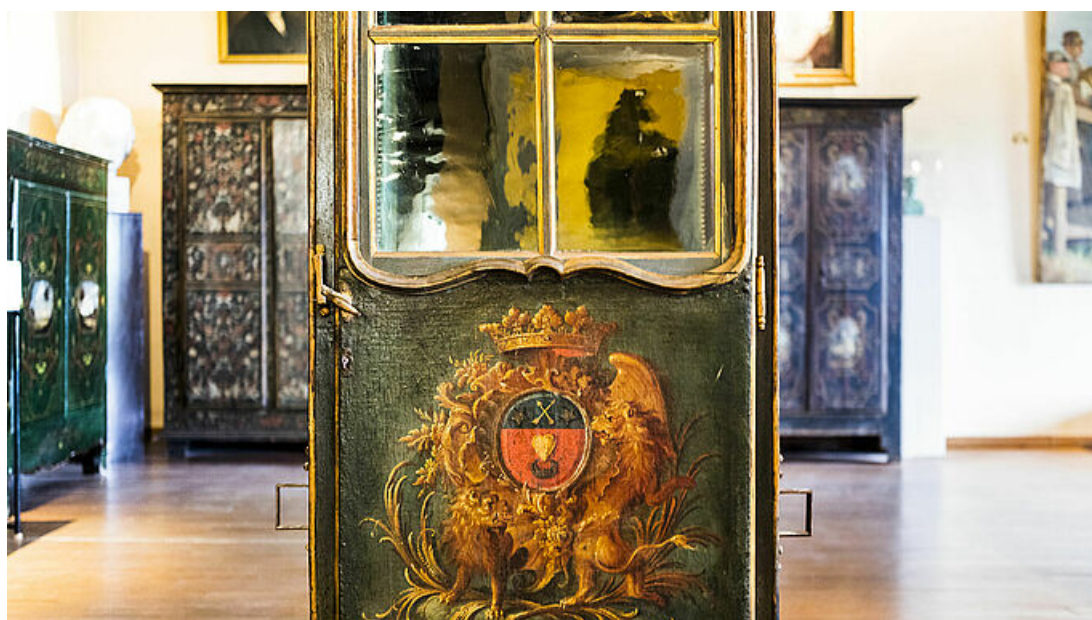
Musée Georges Borias d'Uzès