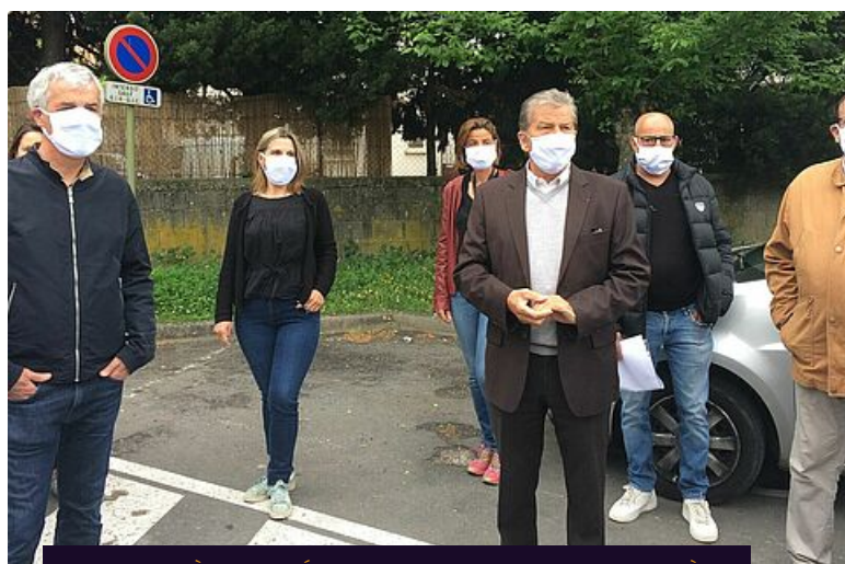
PRATIQUE À VIVRE, DÉPLACEMENT, RISQUES MAJEURS, UZÈS