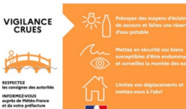
DÉMARCHES, INONDATION, RISQUES MAJEURS