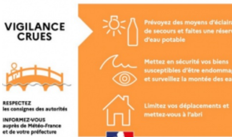
DÉMARCHES, INONDATION, RISQUES MAJEURS