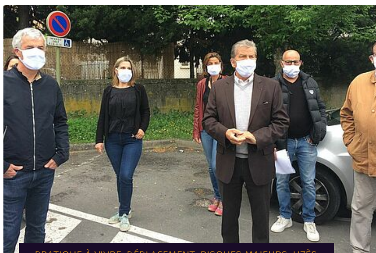
PRATIQUE À VIVRE, DÉPLACEMENT, RISQUES MAJEURS, UZÈS