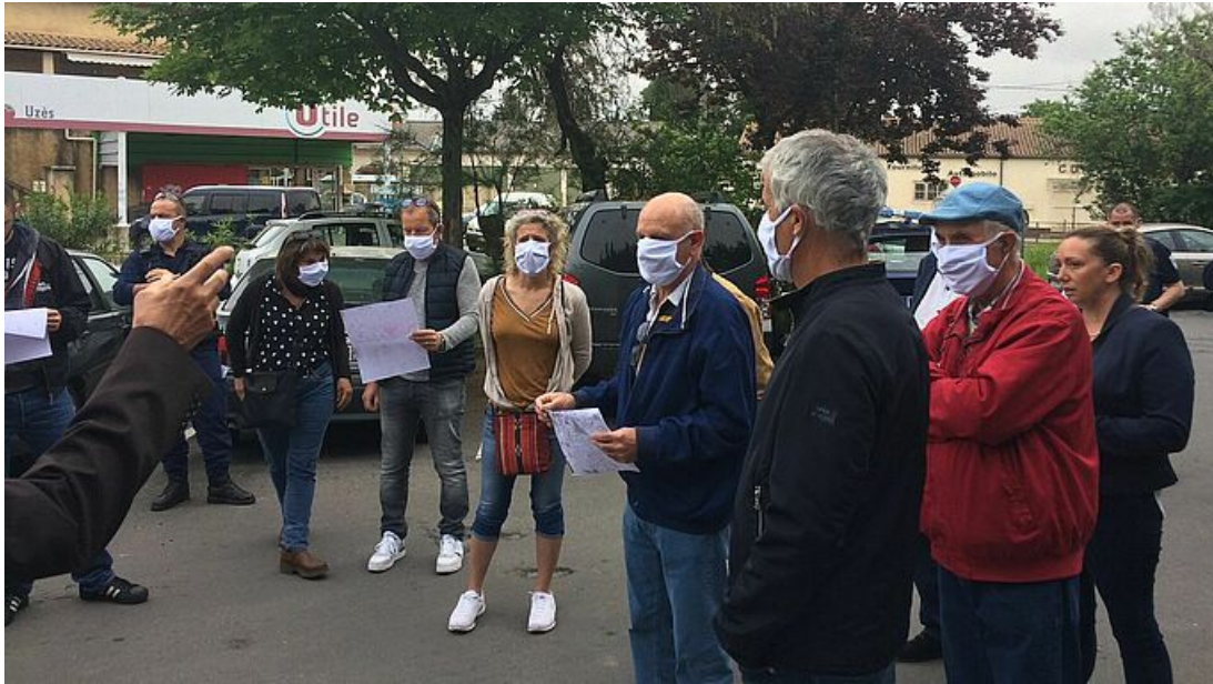
Les élus municipaux passent par groupe dans tous les quartiers. Ils remettent gratuitement un masque par personne.