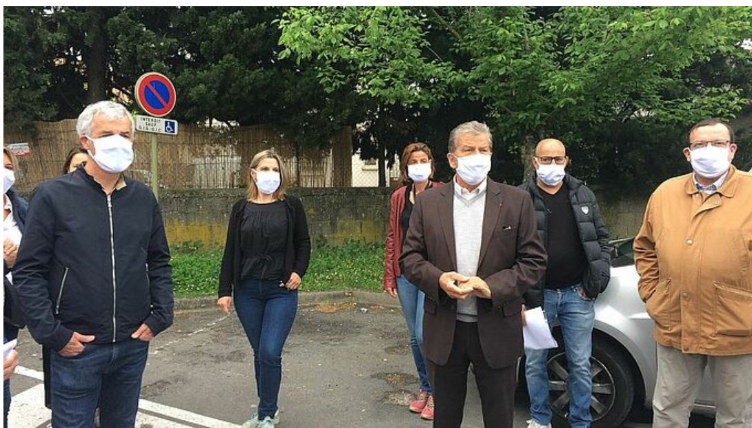
Jean-Luc Chapon, maire d'Uzès (au centre) lance officiellement la distribution des masques lavables sur Uzès. La distribution s'effectue quartier par quartier.

Le maire d'Uzès, Jean-Luc Chapon et les élus communaux ont démarré ce lundi 27 février la distribution des masques lavables au domicile de chaque Uzétien. Elle s'effectue sur deux jours.