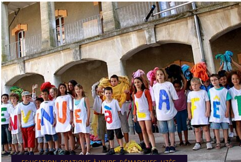
EDUCATION, PRATIQUE À VIVRE, DÉMARCHES, UZÈS

La Ville d'Uzès informe ses habitants que les bureaux de votes passent de 5 à 8 pour les élections municipales.