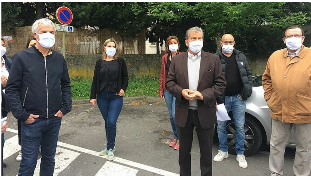
Le port du masque reste obligatoire jusqu'au 10 novembre inclus sur Uzès et dans le Gard - en extérieur y compris dans un lieu ou établissement ouvert au public.