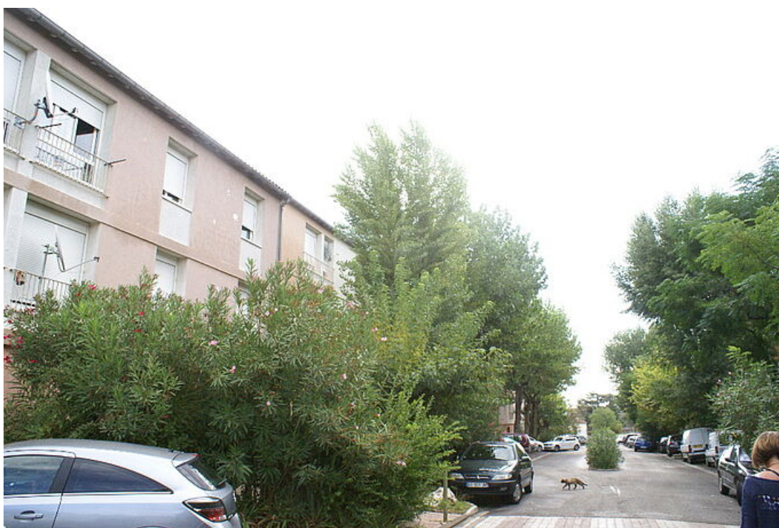
Quartier des Amandiers, Uzès

La Communauté de communes Pays d'Uzès en partenariat avec l'Etat et le Département lance l'appel à projets 2016, contrat de ville d'Uzès à destination des associations et des collectivités pour le quartier prioritaire d'Uzès. Les objectifs et les enjeux à 5 ans sont désormais définis. Ils prendront corps dans l'appel à projets qui vient d'être lancé.