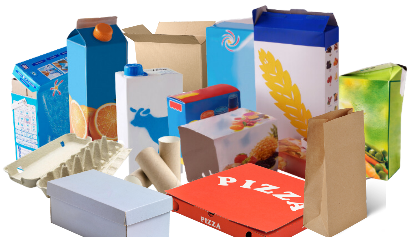
les emballages en carton et briques alimentaires