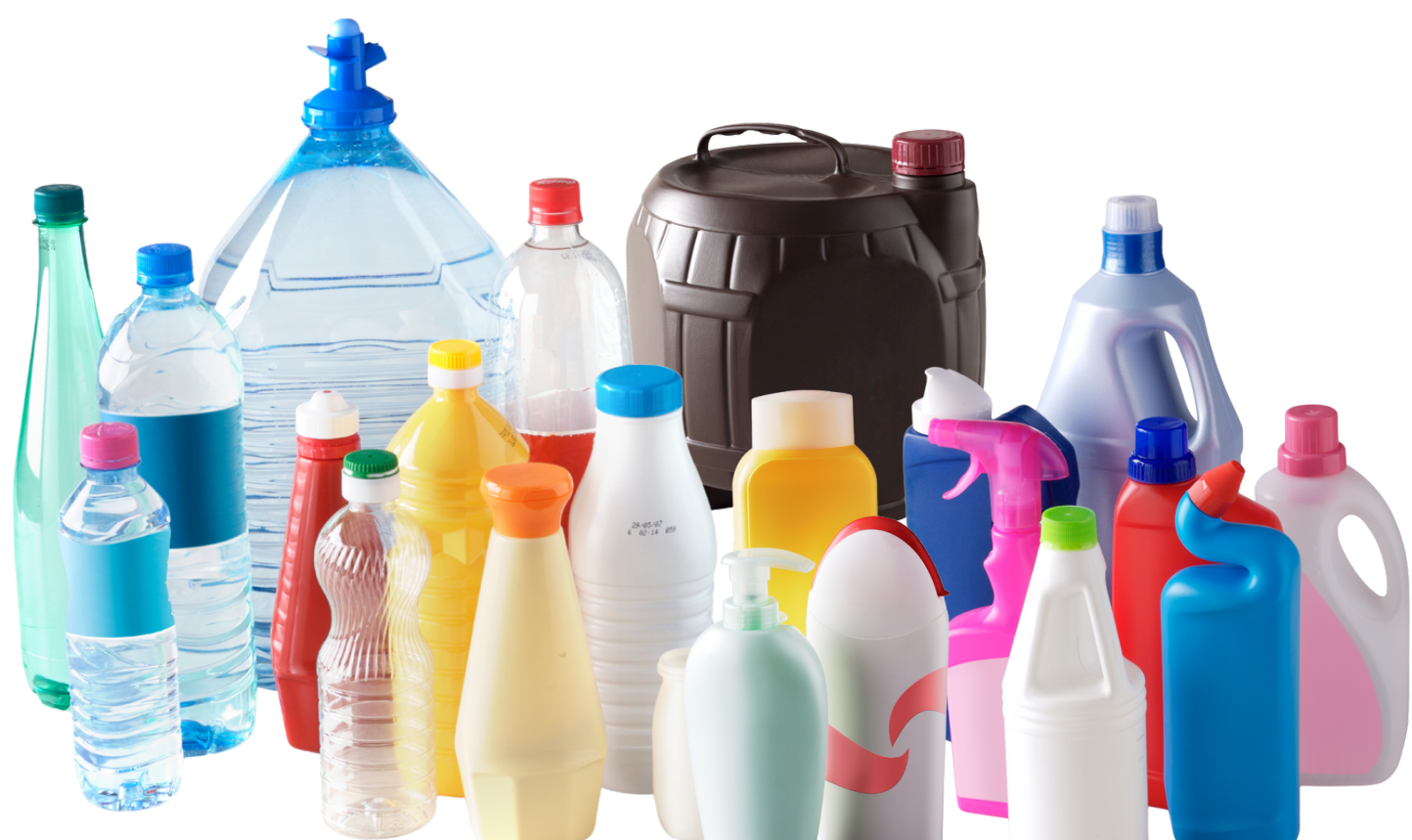
les bouteilles et flacons en plastique