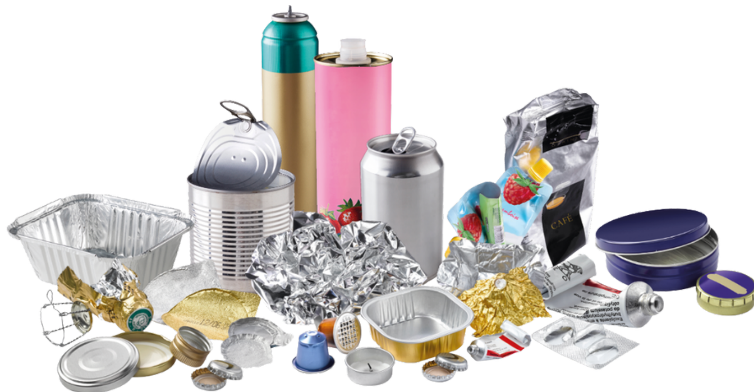
les emballages métalliques