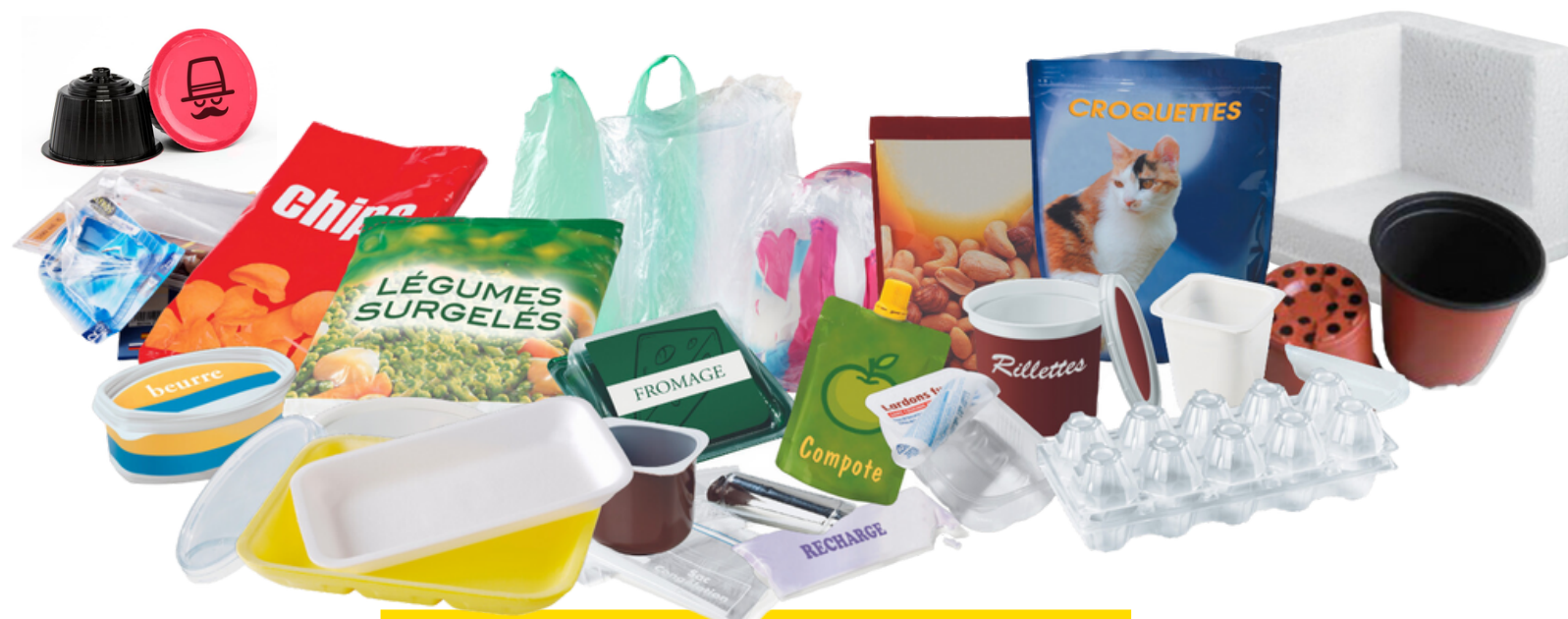
les pots, barquettes et films en plastique