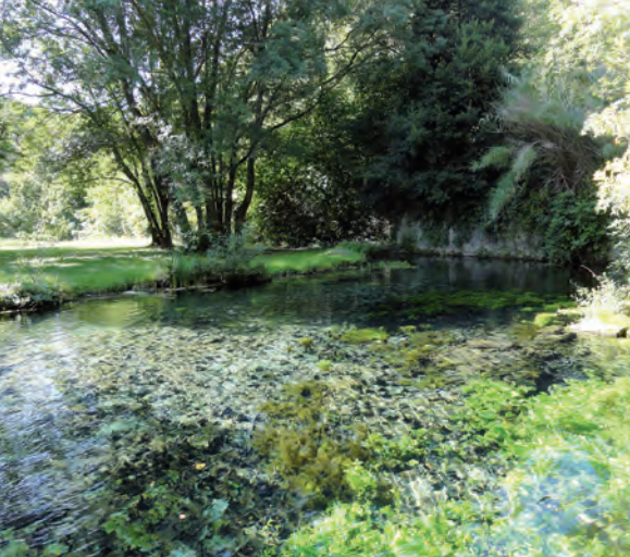
La fuente de Eure en el valle del Eure.

Uzès empieza a extenderse hacia el oeste a partir del siglo XIII. Un nuevo barrio comercial se desarrolla alrededor de la Place aux Herbes . Un siglo más tarde aparecen, fuera de las murallas, los suburbios donde se instalan numerosas posadas y artesanos. También se construye el primer hospital.