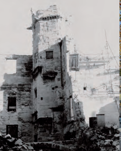
El Hôtel de Roche antes de su restauración, calle Paul Fousnat.

Edificada en el siglo XI, la catedral de Saint-Théodorit fue destruida durante las guerras de religión. De la época medieval sólo se conserva la torre campanario llamada torre Fenestrelle, único campanario circular de estilo románico de Francia. Reconstruida por completo en el siglo XVII, se