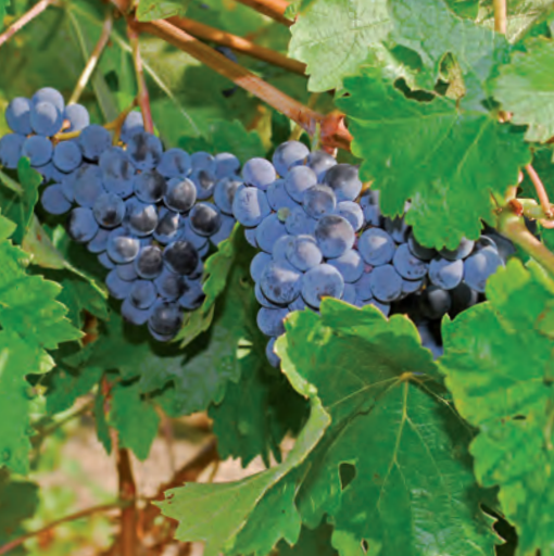
Los vinos del Duché d'Uzès gozan de la denominación de origen controlada desde 2012.