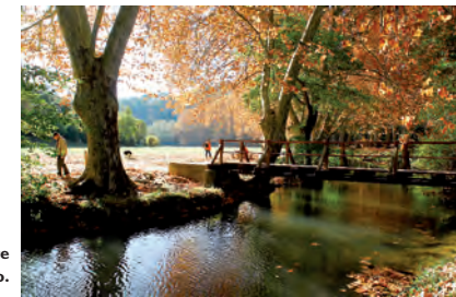
El valle del Eure y el río Alzon en otoño.

Los romanos consiguieron captar las aguas de los manantiales de Eure. Vestigios del acueducto romano, uno de sus dos embalses de regulación y antiguos molinos se pueden ver hoy en día a lo largo del Alzon, el río principal del valle.