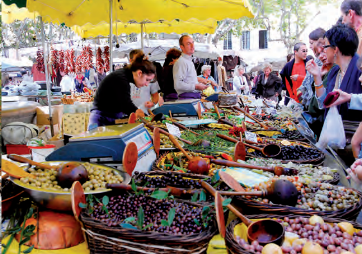
Las aceitunas: un producto típico de la región.