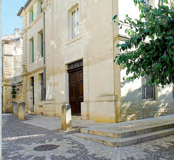
La Rue Port-Royal (antigua Rue de la Monnaie) ha sido la calle principal de Uzès hasta la destrucción de las murallas.