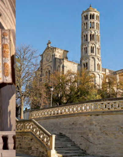
La catedral de Saint-Théodorit y la torre Fenestrelle.