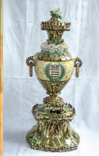
Jarrón destinado a la sala del consejo municipal del ayuntamiento de Uzès, alfarería Pichon, finales del siglo XIX, museo Georges Borias.