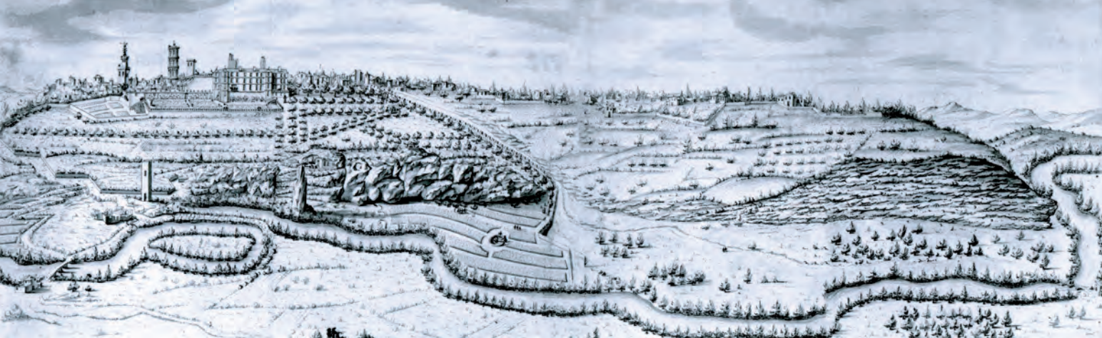
Vista del valle de Eure y del palacio episcopal.