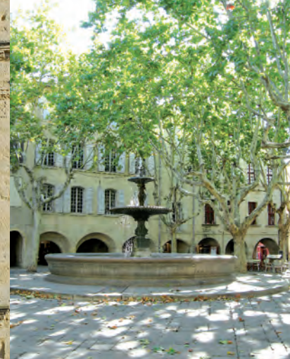
La fuente central de la Place aux Herbes construida en 1855.