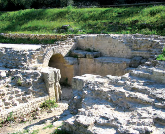
Situado en el valle del Eure, el embalse de regulación del acueducto romano permitía tanto regular el flujo de las canalizaciones derramando el exceso de agua en el río Alzon, como cerrar el acueducto para limpiarlo o arreglarlo.

En el siglo XVI, la mayoría de la población se convierte al protestantismo. A partir de 1621, este nuevo bastión protestante participa en las guerras de Rohan, una rebelión organizada contra las represiones ejercidas por el poder monárquico. La victoria de Luis XIII en 1629, marca el inicio de la reconstrucción de los edificios