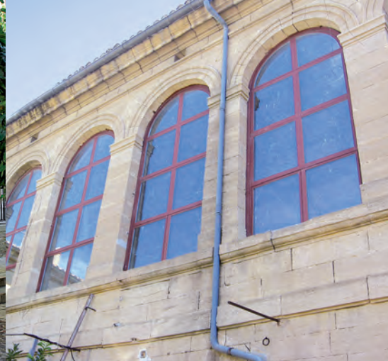
Antigua hilandería Vincent en la Esplanade.

católicos destruidos por completo durante las guerras de religión.