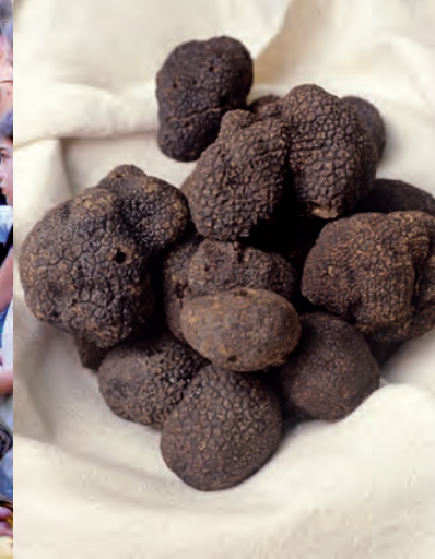
El diamante negro o tubermelanosporum .