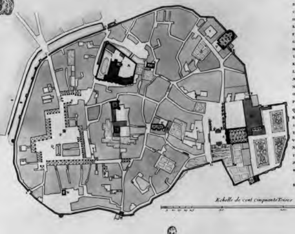
Plano de Uzès hacia 1720.