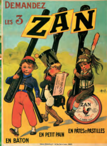
Postal sacada de un anuncio de la marca Zan.