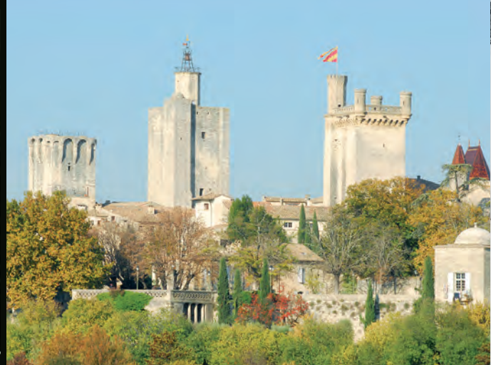
Las tres torres señoriales de Uzès. De izquierda a derecha: la torre del Rey, la torre del Obispo y la torre Bermonde (torreón del palacio ducal).