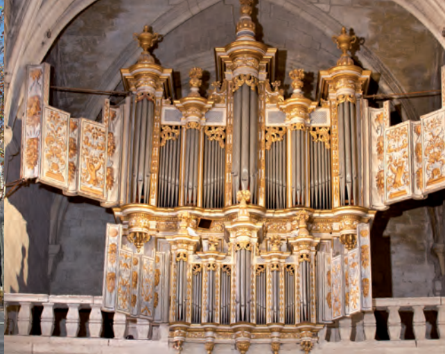
El órgano de la catedral de Saint-Théodorit, finales del siglo XVII.