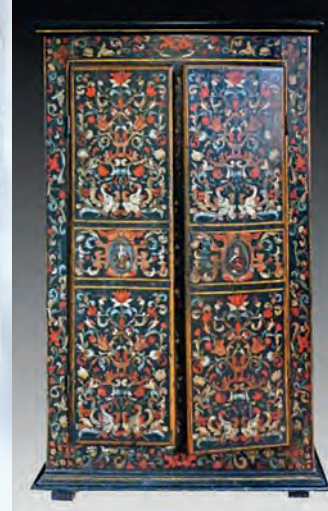
" Armoire d'Uzès ", armario típico con decoración policroma, principios del siglo XVIII, museo Borias.