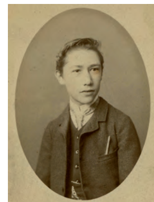
André Gide a los 16 años.

El boticario Moÿse Charas (1619-1698), el traductor Pierre Coste (1668-1747), el escritor y filósofo Firmin Abauzit (1679-1767), el pintor Xavier Sigalon (1787-1837) y el economista Charles Gide (1837-1932) son otros habitantes famosos de la ciudad.