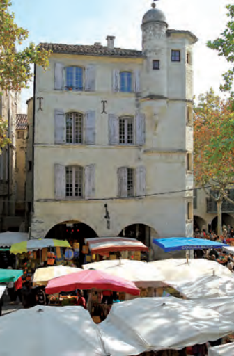
El mercado del sábado en la Place aux Herbes.

Las primeras fábricas de regalices se establecen en Uzès a finales del siglo XIX. El regaliz se convierte rápidamente en una nueva oportunidad económica mientras desaparecían las hilanderías. En 1884, Paul Aubrespy deposita la marca “Zan”. Los palitos, polvos, caramelos duros y pastillas blandas de regaliz de Zan marcaron profundamente la historia de la ciudad y de la raíz. Adquirida por Haribo en 1987, la fábrica de caramelos permanece en Uzès, en el barrio del Pont-des-Charrettes.