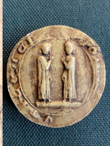
Sello de los cónsules de Uzès (molde conservado en el archivo municipal de la ciudad).