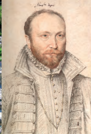
Retrato de Antoine de Crussol, primer duque de Uzès (1528-1573). Dibujo de Clouet conservado en el castillo de Chantilly.