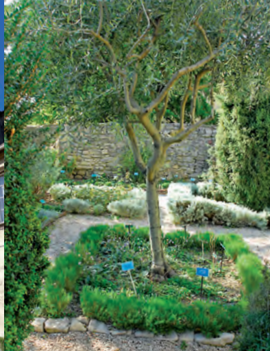
El jardín medieval.