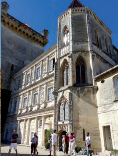
El palacio ducal: la torre Bermonde, la fachada renacentista del edificio principal y la capilla reconstruida en estilo neogótico durante el siglo XIX.