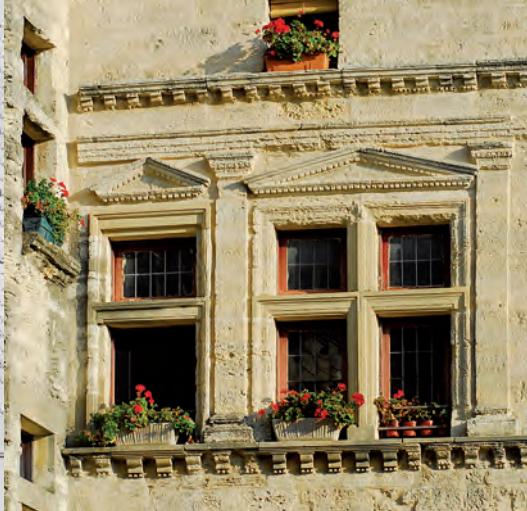
Dos ventanas renacentistas en el tercer piso de la fachada sur del palacete André, Plan Saint-Etienne.