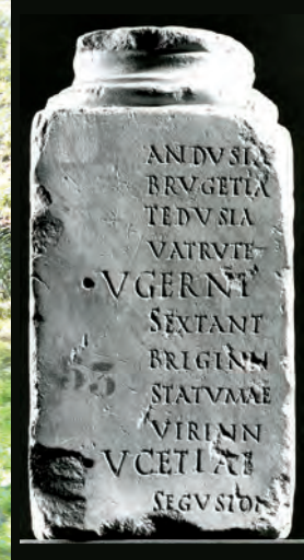
Lápida del siglo I d. C. mencionando la ciudad romana de Ucetia, museo arqueológico de Nimes.