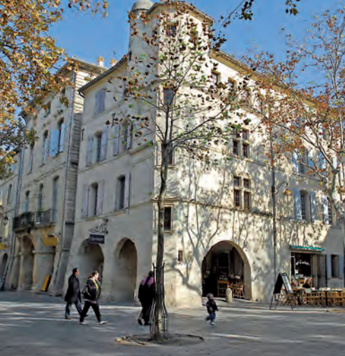
La Maison Almeras en la Place aux Herbes, principios del siglo XVII.